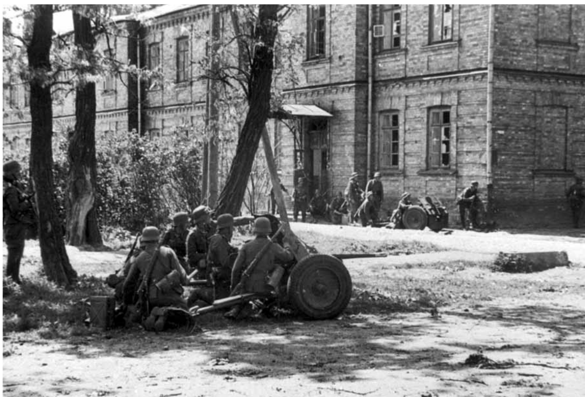
Немецко-фашистские войска ведут бой у стен Брестской крепости. Брест, 1941