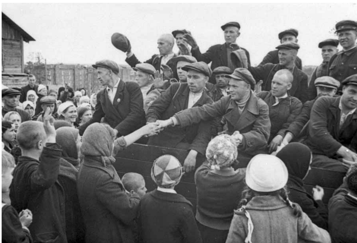
Молодые рабочие, мобилизованные в ряды Красной Армии, отправляются в расположение своей части. Московская область, 1941.