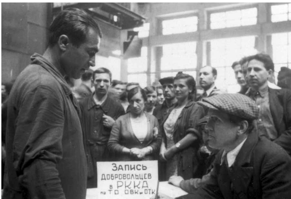
Запись добровольцев в Красную Армию на заводе им. Сталина. Ленинград, 1941.