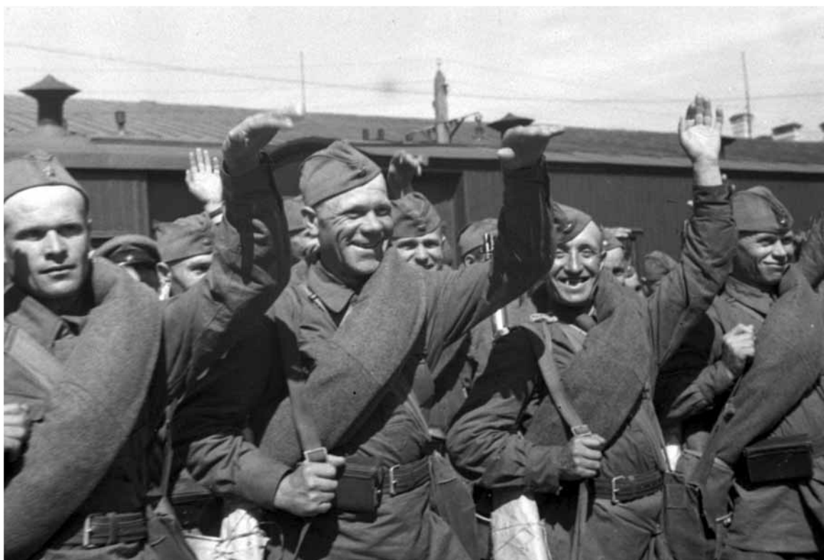
Бойцы Красной Армии отправляются на фронт. Ленинград, 1941