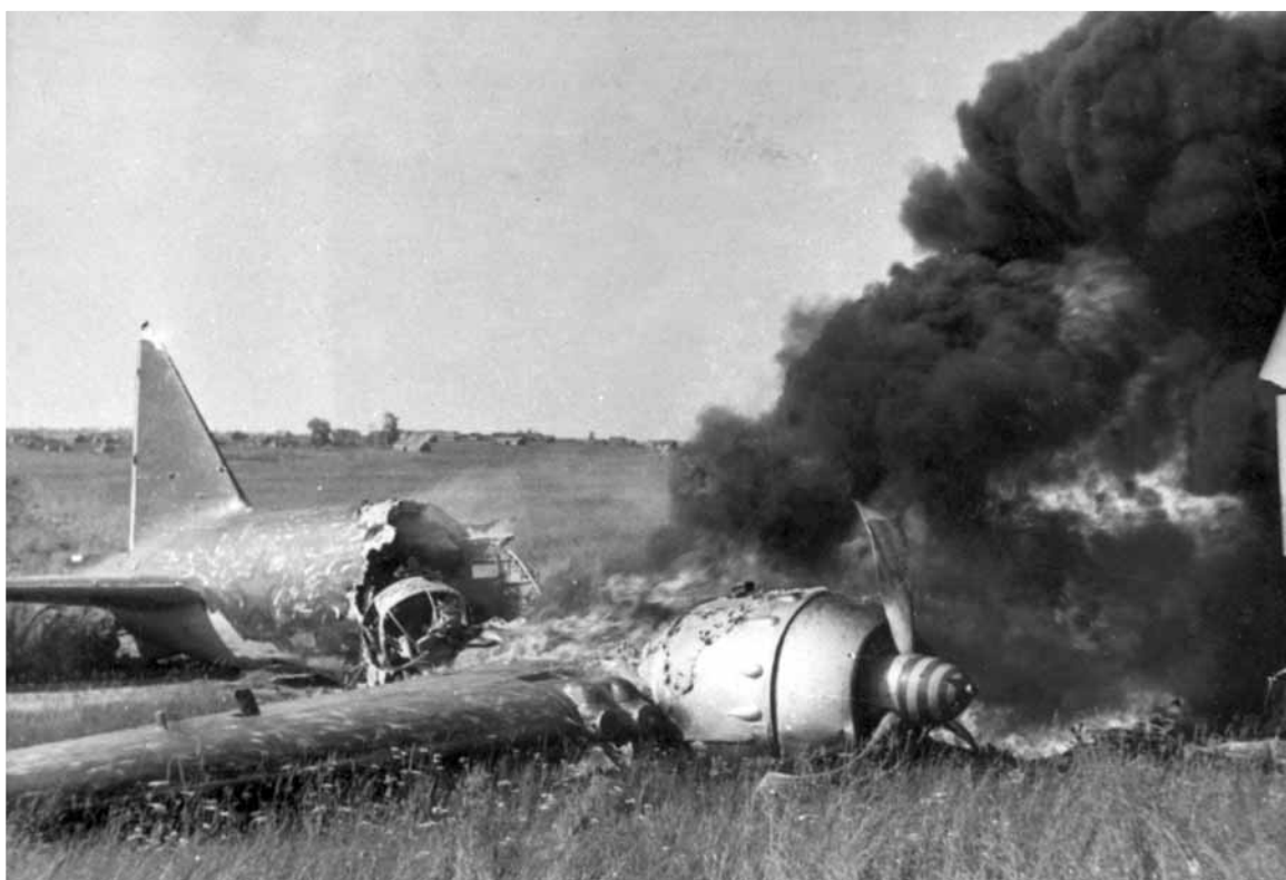
Сбитый советский бомбардировщик. Смоленск, 10 июля 1941