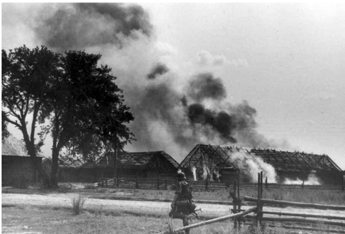
Начало боевых действий фашистской Германии против СССР. Белорусская ССР, 1941.