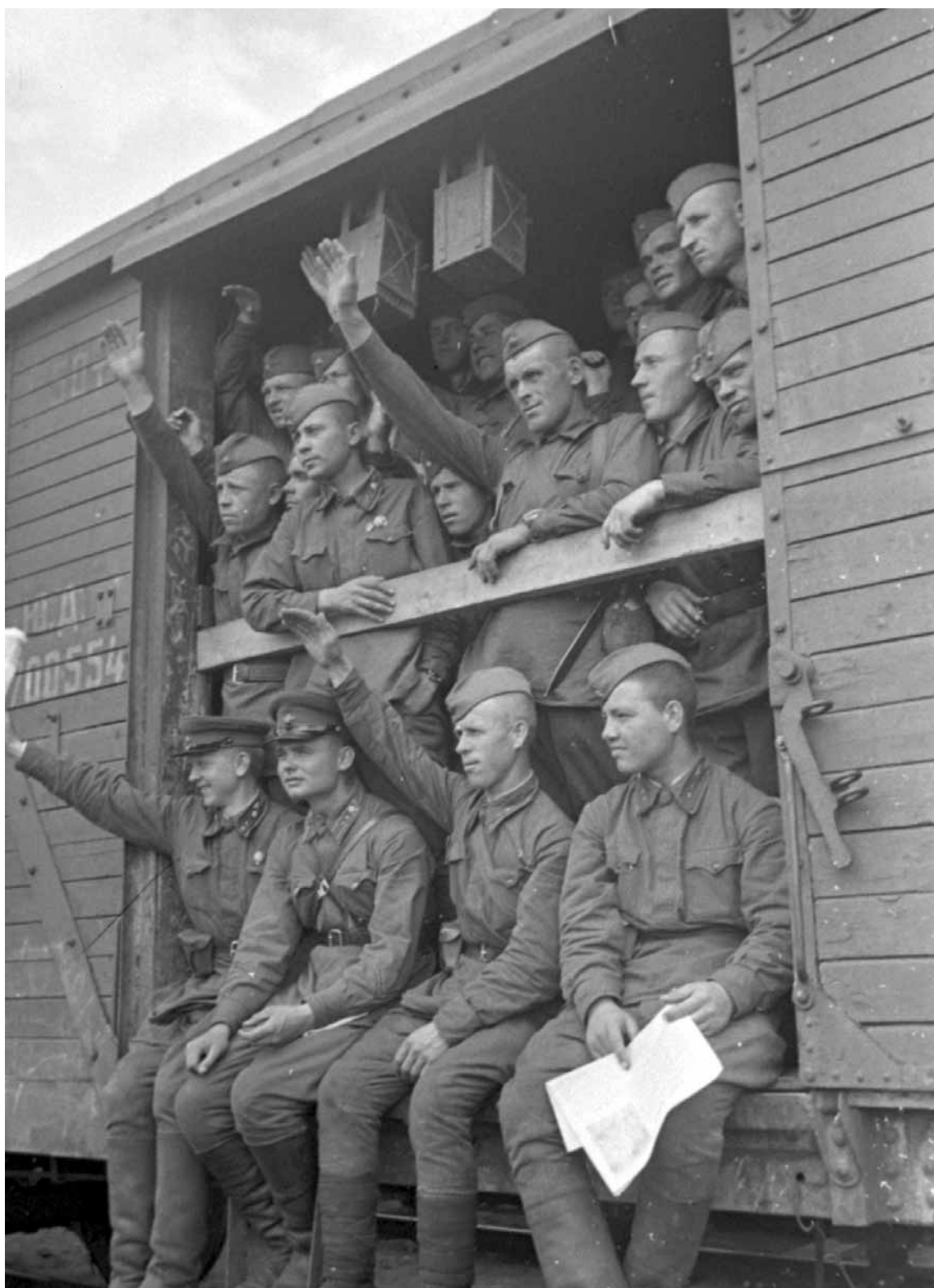
Советские воины отправляются на фронт. Тамбовская обл., 1941.