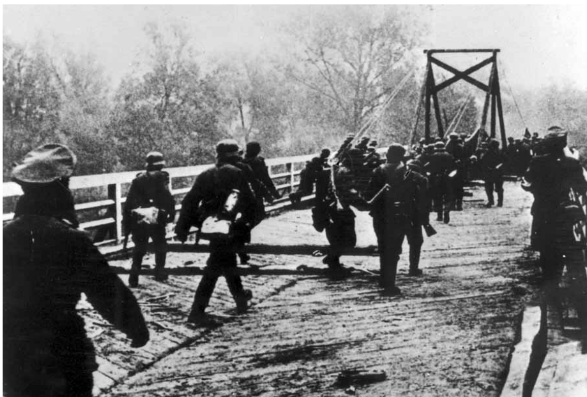
Войска фашистской Германии переходят пограничную реку. 22 июня 1941.