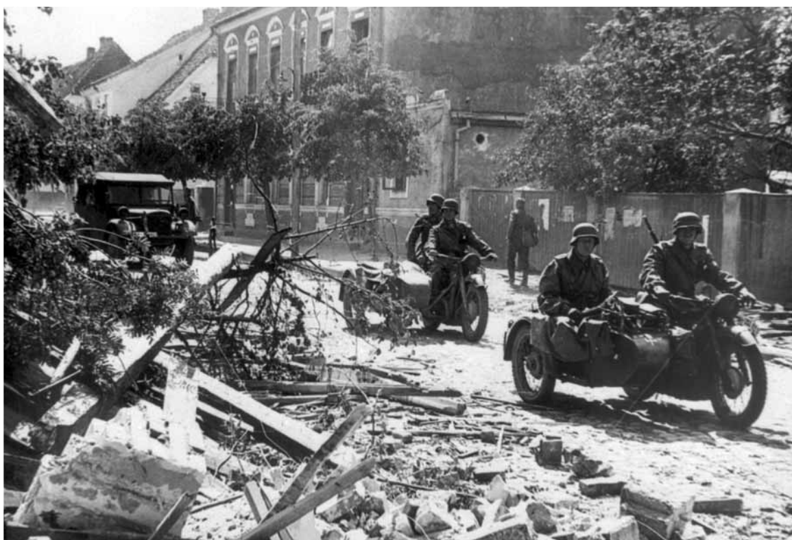
Начало боевых действий фашистской Германии против СССР. Литовская ССР, 1941.