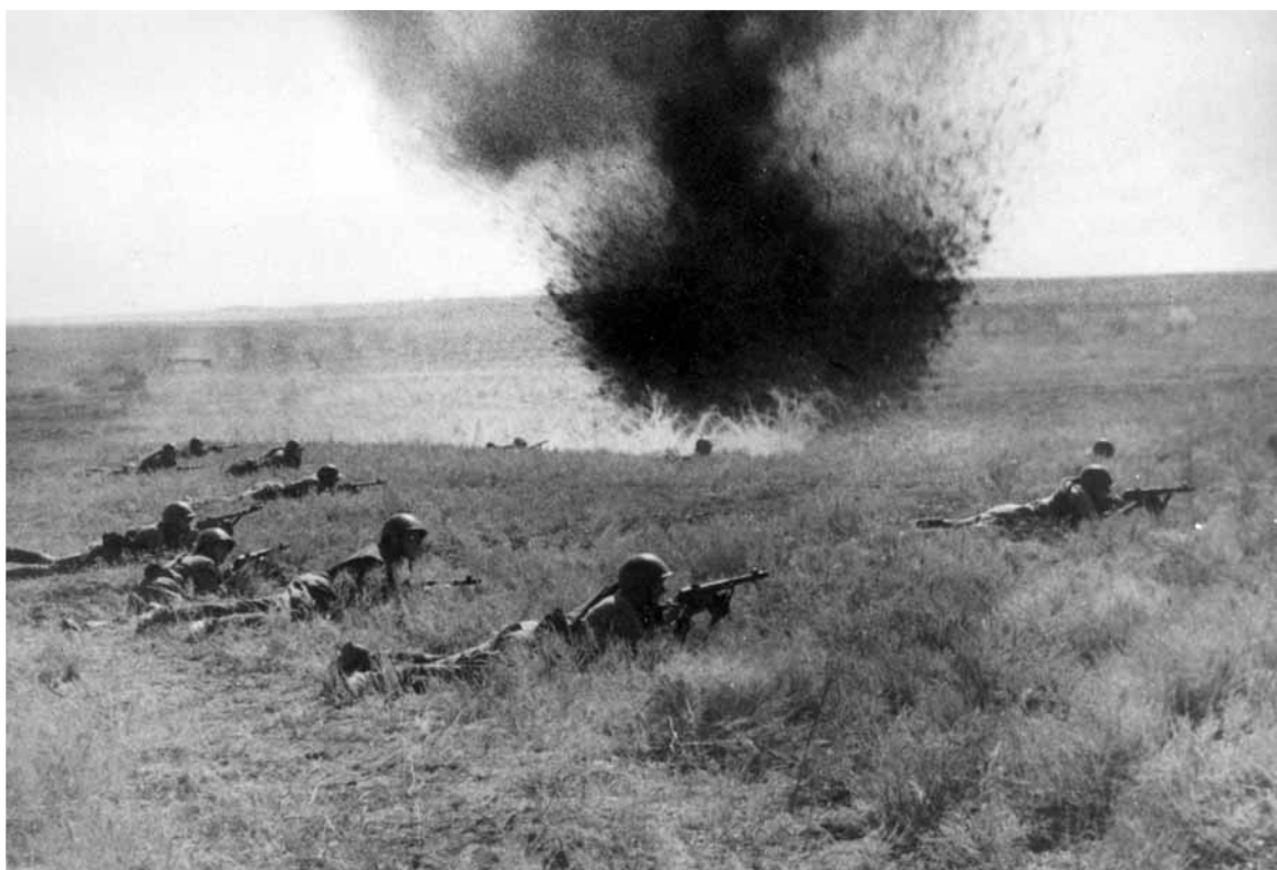
Бойцы Красной Армии на поле боя под Киевом. Украина, 1941.