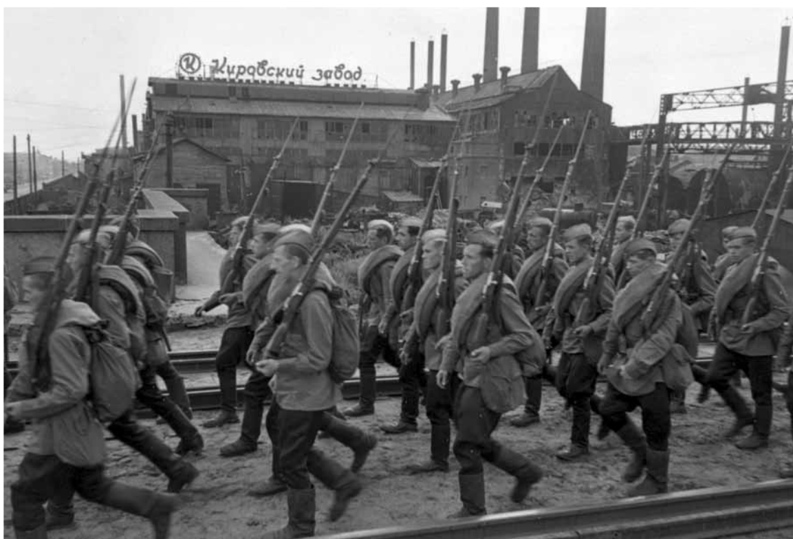
Рабочие Кировского завода уходят на фронт. Ленинград, 1941.