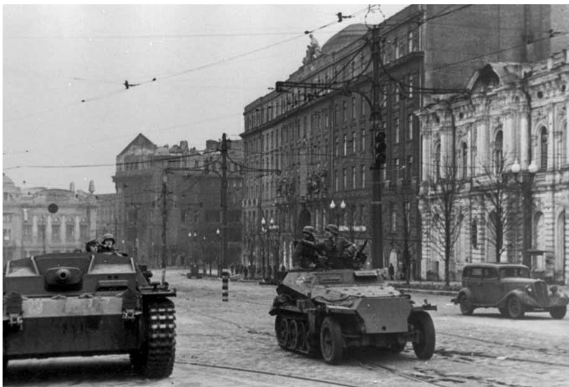
Гитлеровские самоходные орудия на одной из улиц Харькова. 1941