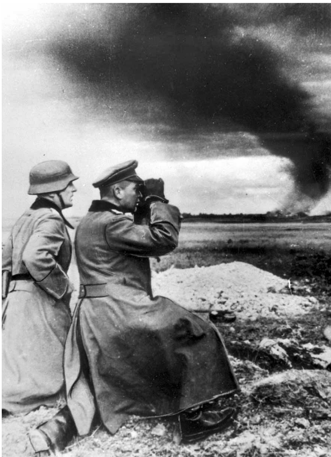
Немецкий генерал Крюгер в окрестностях Ленинграда. Ленинградская обл., 1941