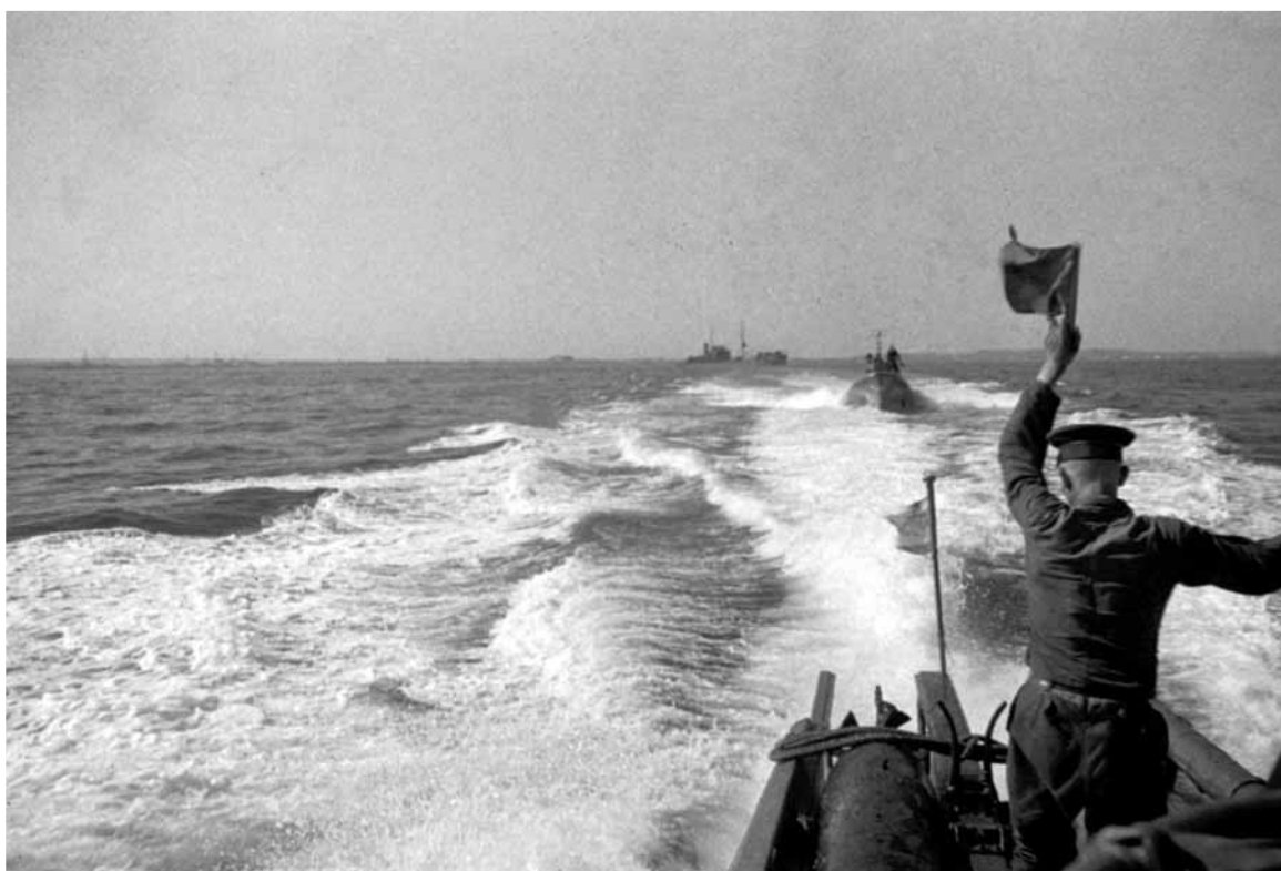
Советские торпедные катера, охраняющие берег г. Одессы, в разведке в море. Черное море, 1941