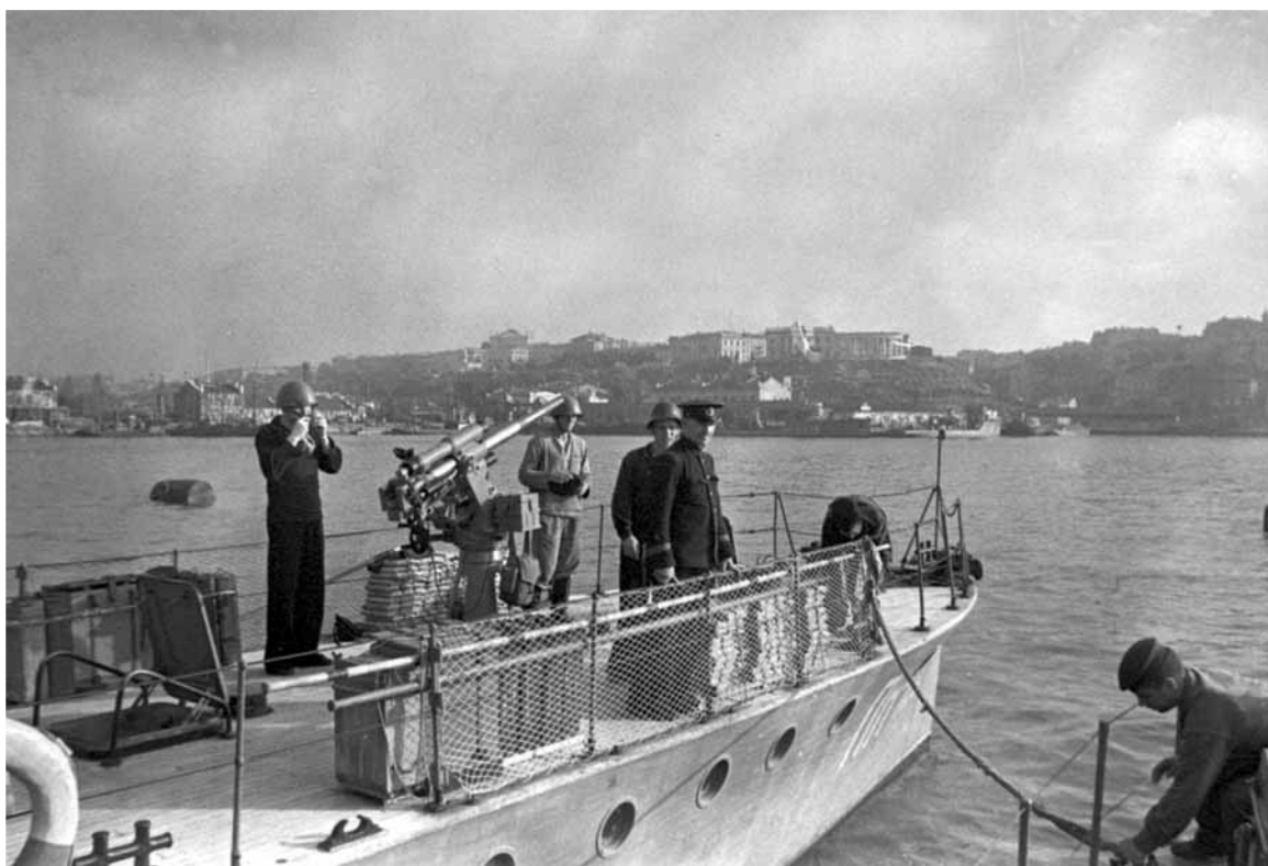
Бронекатер с зенитным орудием в Одесском порту в дни обороны города. Одесса, 1941.