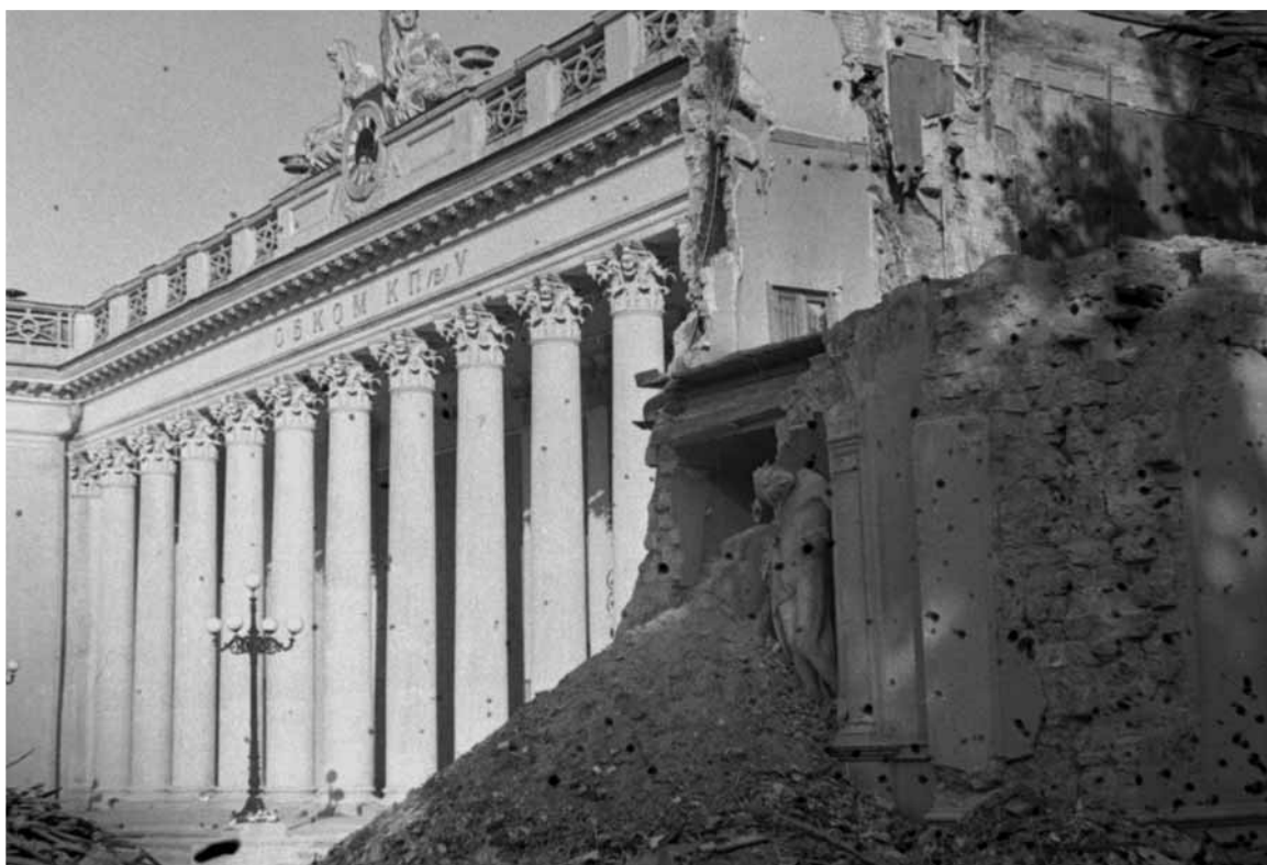
Вид здания Одесского обкома КП(б) Украины, разрушенного во время бомбардировки. Одесса, июль 1941.