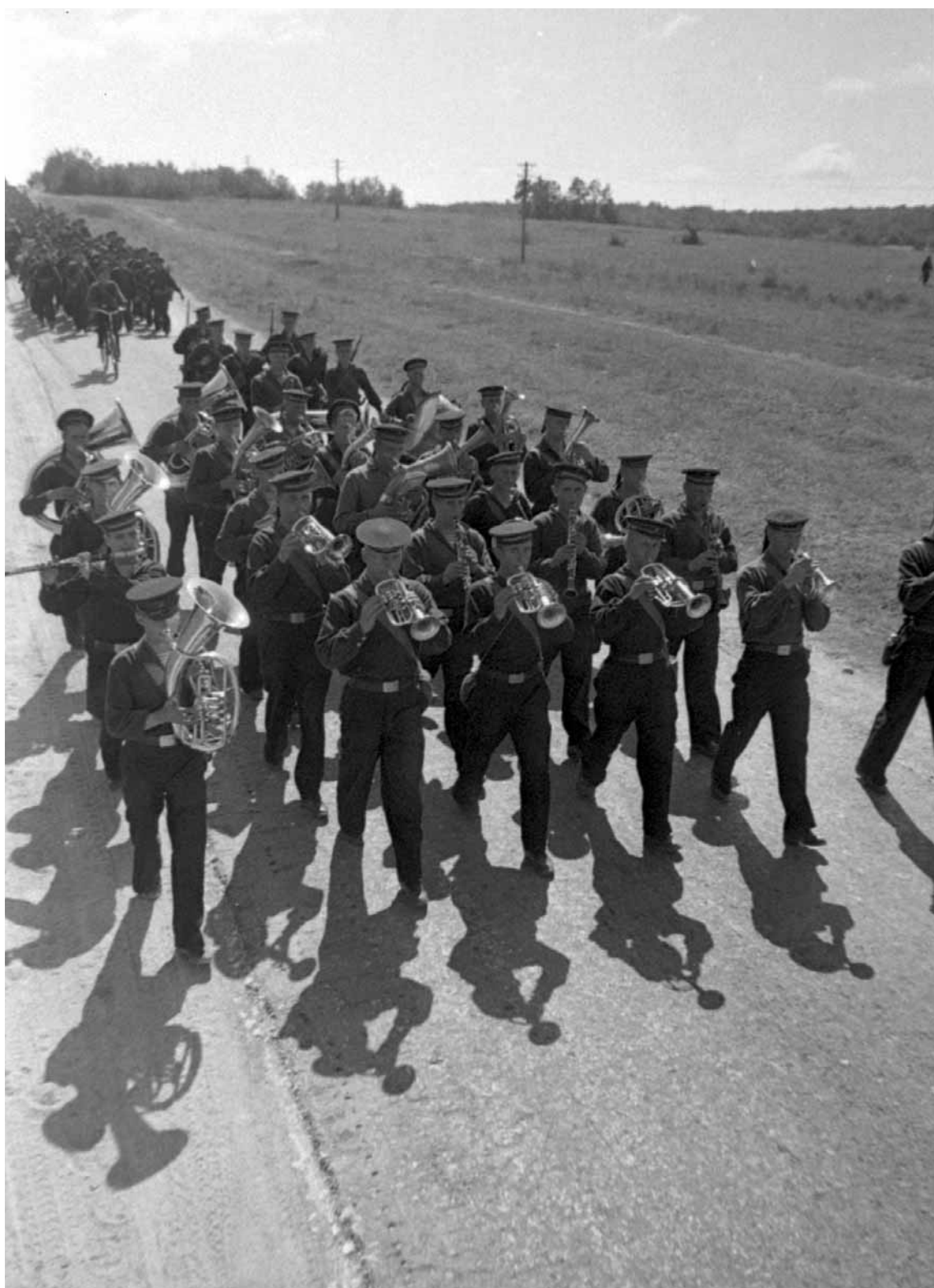
Колонна моряков Черноморского флота, прибывших для защиты г. Одессы. Украина, район Одессы, август 1941.