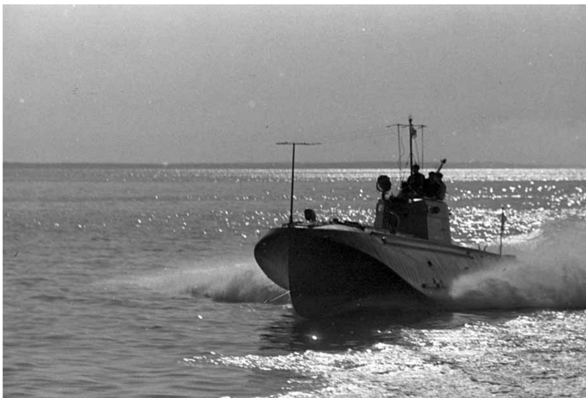
Торпедный катер Черноморского флота в море. Район Одессы, сентябрь 1941.