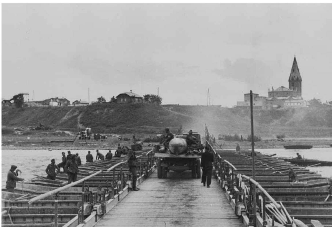
Части немецких войск передвигаются по понтонному мосту. Район Нарвы, август 1941