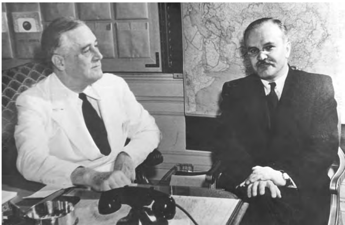
Прием президентом США Ф. Рузвельтом наркома иностранных дел СССР В. М. Молотова в Белом доме. Июнь 1942 г.