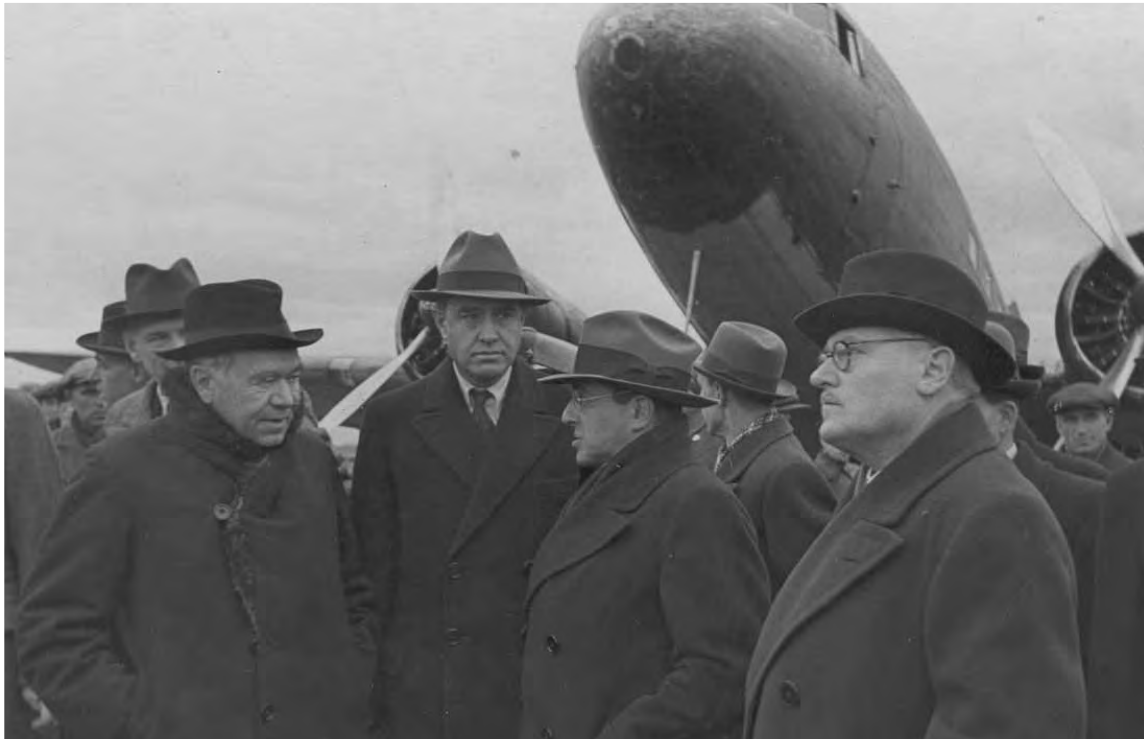
Встреча делегаций, прибывших в Москву на конференцию представителей трех держав — СССР, США и Великобритании. Слева направо: глава делегации США У. А. Гарриман, глава делегации Великобритании У. М. Бивербрук, посол СССР в США К. А. Уманский, заместитель народного комиссара иностранных дел СССР А. Я. Вышинского. 28 сентября 1941 г.