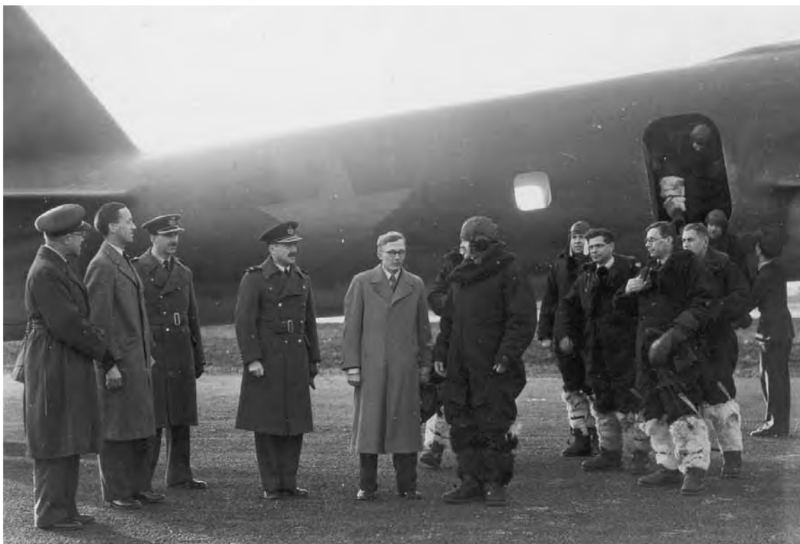
Прибытие в Великобританию наркома иностранных дел СССР В. М. Молотова. 20 мая 1942 г.