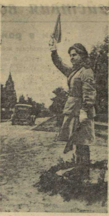
В ПОЛЬШЕ. Регулировщица-красноармеец на военной автомобильной дороге.

Подполковник Н. НЕФЕДОВ. ДЕЙСТВУЮЩАЯ АРМИЯ.