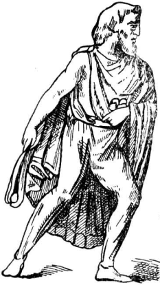
Германец. Рис. с колонны Антония в Риме