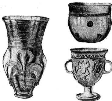
Стеклянные кубки из франкских погребений

В полном соответствии с этой картиной экономического и общественного строя варваров находится и духовная культура. Мировоззрение варварского общества в основном определяется религией, существенные черты которой одинаковы у всех племен: кельты, германцы, славяне поклонялись обожествленным силам и явлениям природы—небу и небесным светилам, ветру, грому и молнии, рекам, озерам, источникам, лесам и т. д. Таранис у кельтов, Тор у германцев, Перун у славян, Перкунас у литовских племен — все это различные обозначения бога грома. Это же божество выступает нередко и под другими наименованиями: Тевтат — у некоторых кельтских племен, Туисто и Тевт — у германских, причем римские писатели сближали его то с Юпитером, то с богом войны Марсом. Точно так же солнечное божество или обычно ему тождественное божество огня, Жара, почиталось под разными именами: Биала — у