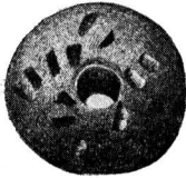
Веретенца из глины, найденные при раскопках в Дрездене и в Франкфурте на Майне

является изобретением арабов в Испании и относится к X—XI вв. Только в XIII в. водка была занесена в Европу, но до XVI в. употреблялась лишь в качестве лекарства (алкоголь — слово арабское).