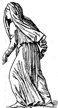
Германка. Рис. с колонны Антония в Риме

Важным дополнением к скотоводству в смысле обеспечения мясом, шкурами и кожей служила охота . Шкуры диких зверей служили и одеждой, и постелью. Рубаху и обувь, прикреплявшуюся к ноге ремнями, делали также из кожи домашних животных. Первоначально в связи с охотой стояло также добывание меда диких пчел. Отсюда еще задолго до н. э. у варваров развилось пчеловодство. Из меда изготовляли излюбленный напиток, заменявший варварам вино южных народов. Из рассказа Приска, посла императора к гуннам, узнаем, что при дворе Атиллы пили преимущественно мед. С развитием земледелия на первый план выступает пиво, брага, изготовлявшиеся без хмеля (это растение даже в IX в. было мало известно). Впрочем, варварская знать, особенно в странах, соседивших с Империей, рано пристрастились к вину, которым ее снабжали римские купцы. Чтобы покончить с напитками, отметим, что водка не была известна ни римлянам, ни варварам. Изготовление спирта и водки