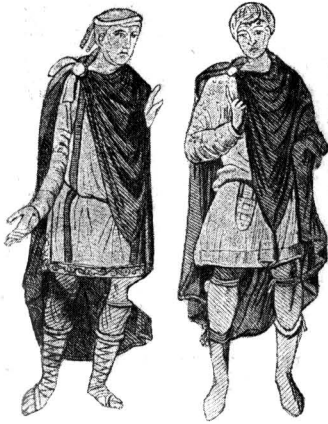
Одежда знатных варваров

главлялся богами Тевтатом, Езусом, Таранисом; у северных германцев — Цию, Воданом (Одином), Тором и богиней брака, любви, плодородия Фрейей, женою Водана; у славян — Дажьбогом, Святovitом, Перуном и пр. Однако этот процесс объединения богов и культов так и не достиг своего завершения. Распространение христианства, нарушение старых межплеменных связей в бурную эпоху переселения народов — все это приостановило дальнейшее развитие языческих религиозных представлений в варварском мире.