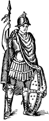
Знатный франкский воин