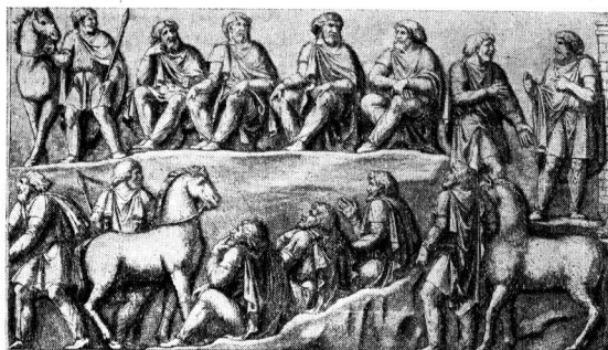
Совет варварских вождей. II в. Рельеф с колонны Марка Аврелия

ниже, чем у древних культурных народов Средиземноморья. Но, как подчеркивает Энгельс, между II и V вв. были достигнуты в этом отношении огромные успехи. От римлян к варварам перешел гончарный круг, а также стеклянное литье. Металлические изделия, ранее привозившиеся из Империи, в этот период вытесняются изделиями местного изготовления. В украшениях оружия, утвари, одежды уже заметно