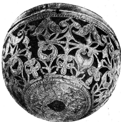
Кельтская чаша с золотым орнаментом