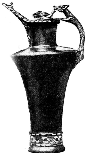
Кельтский кувшин с бронзовыми украшениями, отделанными эмалью и кораллами

сторону. Главным же источником рабства была, конечно, война. Рабы, а также скот, меха и кожи были важнейшими предметами вывоза в Римскую империю, откуда в обмен шли дорогие ткани, одежды, вино, украшения и римские монеты. Известное значение имела и межплеменная торговля.