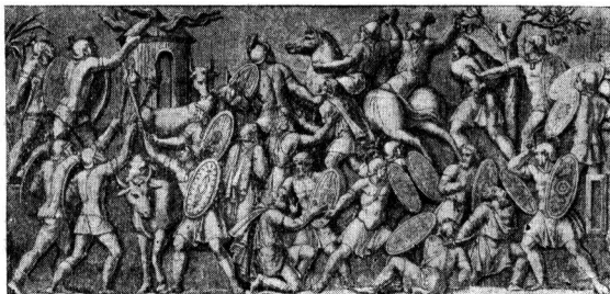
Сражение римлян с варварами. II в. Рельеф с колонны Марка Аврелия

В общем жизнь варваров была скудной, бедной. Самые тяжелые работы по дому и в поле взваливались на женщин и стариков. Мужчины занимались главным образом войной и охотой. В свободное от этих занятий время они отдавались праздности, спали, напивались допьяна, играли в кости. Тацит рассказывает, что, входя в азарт, они проигрывали жен, детей и даже собственную свободу. Таких неудачливых игроков, ставших рабами, продавали на