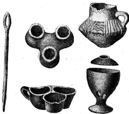
Иголка из рога и глиняные со- суды древних германцев