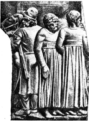
Сарматы. Рис. с колонны Траяна в Риме

бытом, нравами, внешним видом, то греко-римские писатели предпочитали называть их просто варварами (т. е. неримлянами), нередко даже не указывая, к каким племенам принадлежали эти варвары. Только гунны, появившиеся на исторической сцене около 375 г., поразили их своею дикостью, и они отметили полное несходство этих новых страшных врагов Империи по сравнению со всеми другими варварами.