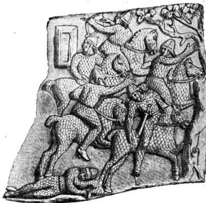
Группа сарматских всадников. Рис. с колонны Траяна