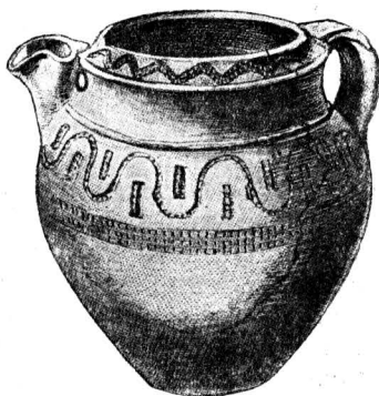
Глиняный сосуд из германских погребений на Рейне