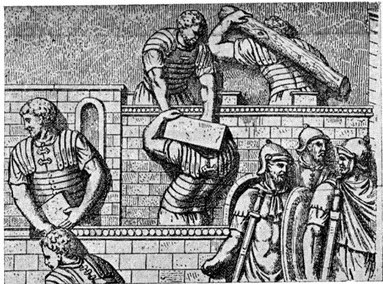
Постройка крепости. Рельеф на колонне Траяна

лии было построено солдатами. В Африке 3-й августов легион (II в. н. э.) строил акведуки, храмы, дороги, триумфальные арки, термы. При раскопках найдено большое количество стандартных кирпичей и черепиц со штемпелем этого легиона. Принужденные длительно пребывать в завоеванных провинциях, римские легионы построили и оборудовали множество постоянных лагерей, превратившихся позже в центры новых городов. Для планировки ла-