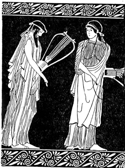
Алкей и Сапфо. Рисунок на аттической вазе V в. до н. э.

Древнейшими литературными произведениями Греции являются передававшиеся из поколения в поколение сказителями-певцами (эодами) и декламаторами (рапсодами), а затем по всей вероятности в VIII—VII вв. до н. э. подвергшиеся окончательной литературно-художественной обработке эпические поэмы «Илиада» и «Одиссея».