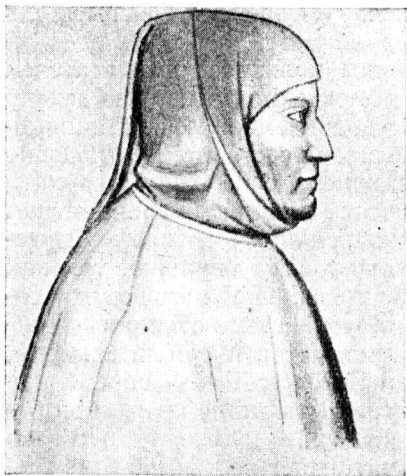
Петрарка. Рисунок пером его друга Ломбарде делла Сала

стьяна Брандта «Корабль дураков». Уже в этом произведении проявляется религиозная направленность, свойственная всему движению. Ставя своей задачей очищение церкви от разъедающих ее пороков и бедствий, Брандт дает широкую и красочную картину всей жизни Германии, изображенной остро сатирическими чертами.