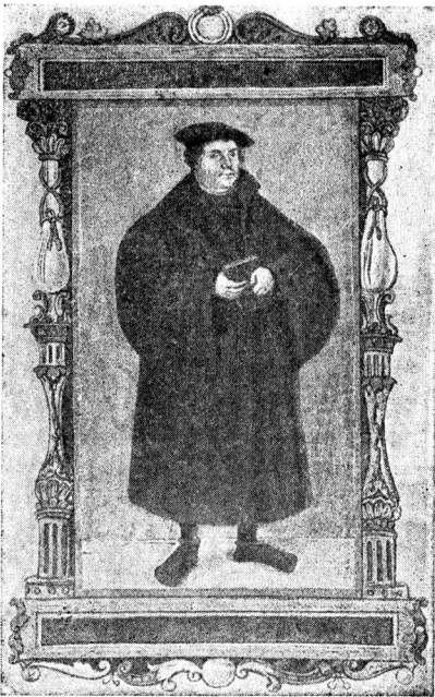
Лютер. Портрет кисти Луки Кранаха

догматов католической церкви, а в 1521 г. официально объявил о своем разрыве с нею. Отлученный папой от церкви, Лютер благодаря поддержке части германских князей избег преследований как духовной, так и светской власти, и его последователи, число которых росло с исключительной быстротой, образовали, впервые за все средневековье, новую, не согласную с католической, христианскую церковь. Однако Лютер не придал этой церкви ни политически, ни социально радикального характера. Наоборот, обязанный своим спасением князьям и зажиточному патрициату