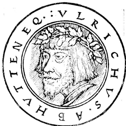
Ульрих фон Гуттен. Гравюра на дереве 1523 г.