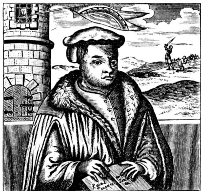
THOMAS MÜNZER, STOLBERGENSIS, PASTOR ALSTED, ARCHIFANATICUS, PATRONUS ET CAPITANEUS SEDITIONOSORUM RUSTICORUM. DECOLLATUS Anno 1525.