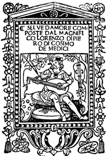
Гравюра на дереве к стихам Лоренцо Медичи

Близким по направлению к Эразму был и второй крупнейший германский гуманист, Иоганн Рейхлин, прославившийся своими филологическими работами в области латинского, греческого и, особенно, еврейского языка. Его защита еврейского текста «священного писания» и еврейских богослужебных книг вызвала резкий протест като-