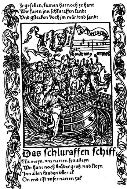
«Корабль дураков». Гравюра на дереве из одноименного произведения Себастьяна Брандта