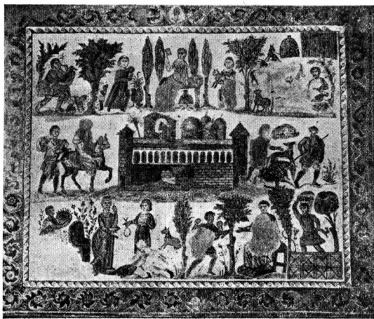
Вилла IV в. Мозаика, найденная в Карфагене

В такой обстановке, окруженный толпою клиентов, нахлебников и гостей, проводит свою жизнь магнат эпохи упадка Империи. Беседы с окружающими,