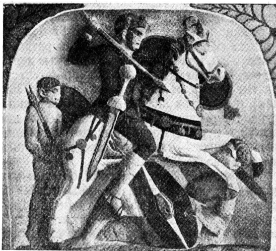
Римский всадник. Надгробное изображение