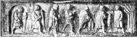
Колоны приносят владельцу виллы оброк. III в.

свевы, франки, аламанны и другие варварские племена со всех сторон вторгаются в римские провинции, грабят и разоряют города и виллы римских богачей, захватывают земли для поселений и создают на захваченных территориях свои варварские королевства. К концу V в. Римская империя на Западе прекратила свое существование. Вместе с нею отошел в прошлое и рабовладельческий строй. В варварских государствах, ставших на ее место, возникают новые порядки, начинается новая жизнь, новое развитие, которое через три столетия привело к установлению господства феодальных отношений.