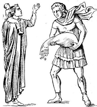
а) Римская женщина IV в. Рис. с барельефа арки Константина б) Слуга. IV—V вв. Рис. с античного диптиха

Наиболее важную роль в сохранении остатков античной культуры сыграли монастыри. Монастыри появляются впервые в III—IV вв. на Востоке — в Сирии и Египте. Это были общежития людей, уходивших из городов «в пустыню», подальше от «мирских соблазнов», чтобы «спасти душу». Вполне понятен успех монастырей в эпоху, когда беспокойная жизнь в миру утрачивала привлекательность даже для многих представителей имущих классов. Вообще же, как указывает Энгельс, «монастыри были ненормальными общественными организмами, в основе их