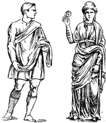
а) Одежда знатного римлянина. V в. Рис. с барельефа арки Константина

Духовная культура греко-римского мира, достигшая высокого уровня к началу нашей эры, испытывает в последние века Империи такой же глубокий кризис, как и рабовладельческое хозяйство. Эта культура