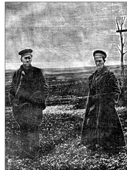
Ф.Г. Подтёлков и М.В. Кривошлыков перед казнью

Вначале вышли Подтёлков с Кривошлыковым. Кривошлыков едва держался на ногах. Затем партиями по 20 человек стали выводить остальных участников экспедиции. Всё происходило просто и буднично. Восемь «подтёлковцев» становились у края ямы. Остальные ждали своей очереди. Тех, на ком оставалось обмундирование, заставили раздеться до белья. Одежду складывали тут же у края ямы.