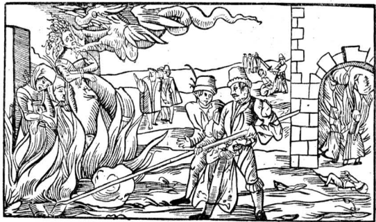
Сожжение ведьм в 1555 г. Гравюра на дереве

В общем, однако, и францисканцы и доминиканцы всемерно укрепляли свою деятельность позиции католической церкви, поколебленные ересями. В частности они