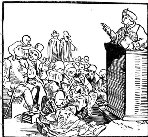
Церковный проповедник. Гравюра на дереве 1492 г.

В XIII—XV вв. наиболее видную роль в деятельности инквизиции и в организации ведовских процессов играли доминиканцы. Это были монахи ордена, основанного около 1216 г. фанатичным испанским священником Домиником Гуzmanом с целью борьбы против еретиков. Папство предоставило ордену многочисленные привилегии (право свободной проповеди, право совершать богослужение даже во время интердикта и пр.) и содействовало росту богатств ордена и его могущества. Доминиканцы называли себя «божьими псами», раздирающими зубы тела еретиков.