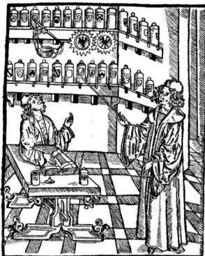
Аптека. Гравюра на дереве XVI в.

значение имел Болонский университет, центр юридического образования в XII—XIII вв. Здесь изучалось римское право, главным образом свод законов Юстиниана ( corpus juris civilis ). Выходившие отсюда доктора права поддерживали и теоретически обосновывали притязания императора на абсолютную власть во всей «Римской империи». Под их влиянием в Германии в XV в. происходит так называемая рецепция (принятие) римского права , т. е. официальное признание римского права действующим в имперских судах и других учреждениях Империи в ущерб местному, провинциальному праву и судебным обычаям национального происхождения. Однако в Германии, ввиду слабости центральной императорской власти и в результате сепаратистских стремлений феодальных князей, рецепция римского права не в состоянии