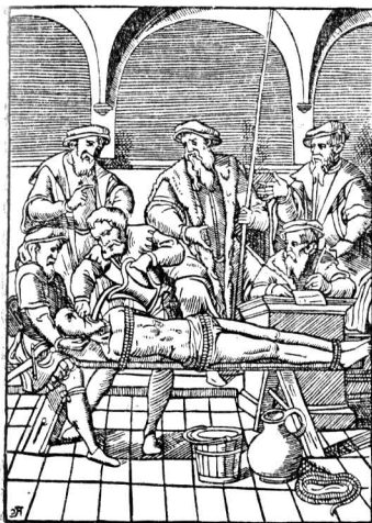
Застенок инквизиции. Допрос под пыткой. Гравюра на дереве XVI в.

«Отныне должны местные власти еженедельно по вторникам, кроме дней великих праздников, учинять сожжение ведьм. Каждый раз их надо ставить на костер и сжигать душ 25 или 20 и никак уже не меньше, чем 15». Сведениями о казнях сотен и тысяч женщин переполнены все хроники этого времени.