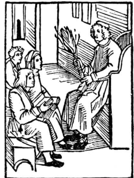
Учитель и ученики. Гравюра на дереве 1505 г.

Задача схоластики состояла в том, чтобы доводами разума и ссылками на всевозможные авторитеты обосновывать справедливость феодального общественного строя и истинность догматов католической церкви. В развитии схоластической науки бывали моменты, когда она эту задачу выполняла неудовлетворительно, когда она не столько обосновывала, сколько колебала основы веры. В начале XII в. прославленный французский богослов Абельяр, сопоставляя в своей книге «Да и нет» различные авторитеты, показал, что они противоречат друг другу. Он хотел лишь указать, что возможно примирить даже противоречивые утверждения, но церковь нашла его деятельность вредной и подвергла его жестоким преследованиям. К этому времени в схоластической философии выявились две школы — реалистов и номиналистов, которые, в пылу борьбы друг с другом, затрагивали основные догматы религии. Поэтому некоторым наиболее реакционным дея-