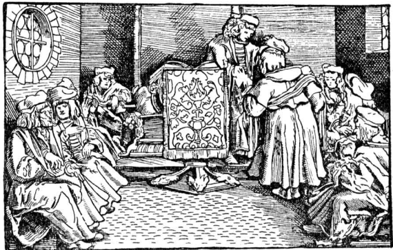
Получение докторского звания. Гравюра на дереве XVI в.