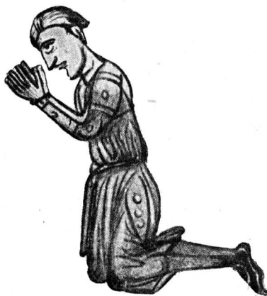
Типы молящихся. Миниатюра рукописи XIII в.

Для систематической борьбы с ересями церковь выковала в течение XII—XIII вв. страшное оружие — инквизицию . Сначала функции инквизиторов, т. е. расследователей дел об еретиках, поручались епископам. Когда же выяснилось, что епископы, поглощенные своими светскими интересами, с этой задачей не справляются, папство начало организовывать спе-