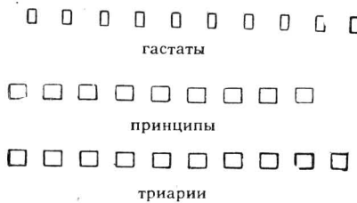
Построение римского войска

600 триариев составляли легион. Каждая из этих категорий воинов делилась в свою очередь на 10 манипул, а каждая манипула — на 2 центурии. За манипулами гастатов, располагавшимися впереди с известными промежутками одна от другой, выстраивались принципы, а за ними — триарии. Гастатами были молодые отборные воины, триариями — ветераны. Общеупотребительное выражение «дело дошло до триариев» означало, что были втянуты в бой последние, наименее боеспособные резервы живой силы. В результате такого построения фаланга перестала быть сплошным, нерасчлененным целым. Новое построение позволяло сохранять в бою порядок и избежать давки.