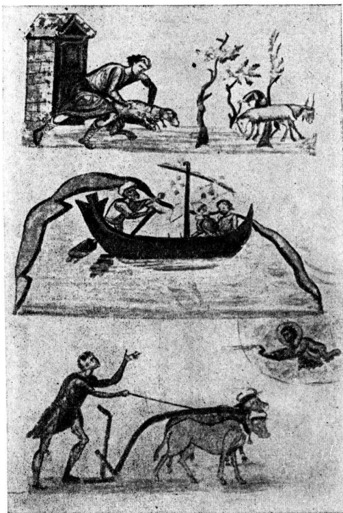
Миниатюры из рукописи XI—XII вв.:

Особое место в литературе Византии занимает так называемая агиография, т. е. «жития святых». Ценность этих памятников заключается во множестве бытовых данных и реже исторических фактов, своеобразно сочетаю-