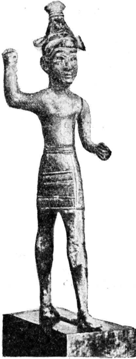
Бронзовая статуэтка ] Ваала, Рас-Шамра