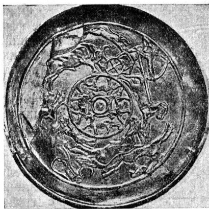
Золотое блюдо. Рас-Шамра