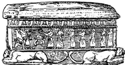
Саркофаг Ахирама. Библос