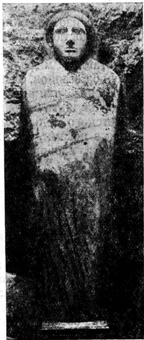
Саркофаг из Сидона