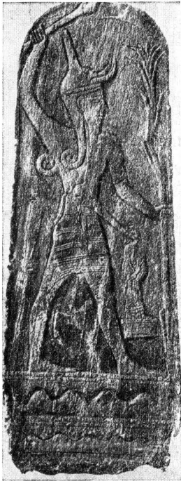
Большая стела Ваала. Рас-Шамра

стекла делались бусы, поддельные драгоценности и т. д. Финикийцы изготовляли также коробки, игрушки и другие изделия из слоновой кости и считались искусными вышивальщиками.