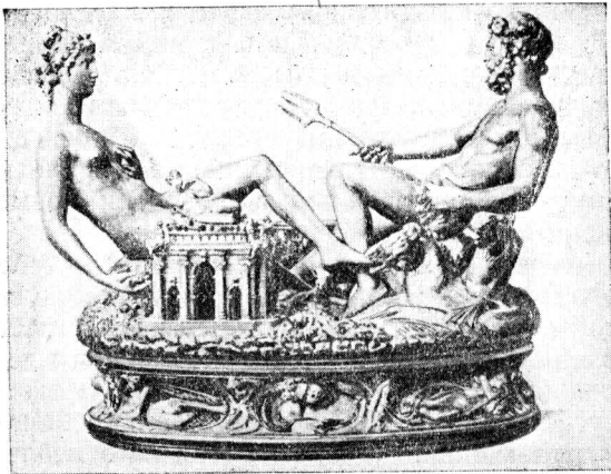
Золотая солонка работы Бенвенутто Челлини

вуали и перья его цветов. Одеты же юноши были в куртки из фиолетового шелка с вышивкой на одном рукаве из жемчужин, числом 350, стоимостью по 3 на дукат... Один паж на коне в куртке, покрытой серебряной чешуей и вышитой белым и позолоченным серебром в подражание древнему панцирю с поножами... Доспех на названном паже — до земли... И весил этот доспех 168 фунтов серебра, по цене 16 дукатов за фунт. Его особа на коне. Воору-