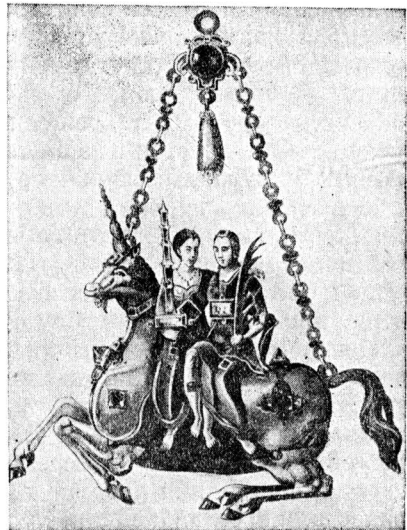
Женское украшение XVI в.