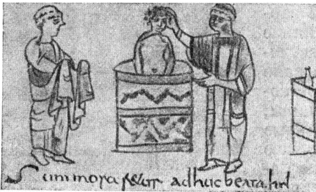
Крещение. Рисунок из рукописи IX в.

При Каролингах мелкие свободные собственники были окончательно разорены и почти сплошь превратились в зависимых или крепостных. Их земли были поглощены монастырями, епископами, светскими магнатами, непрерывно увеличивавшими и округлявшими свои владения. Каролингское законодательство, отражая интересы земельной аристократии, либо содействовало этому процессу, либо не препятствовало ему. Законы IX в. даже предписывали всем свободным обязательно найти себе сеньера. Таким образом, хотя в документах этой эпохи еще сохраняется для одной категории крестьян термин «свободный», фактически и они были обязаны службами и повинностями своим сеньерам, сливаясь с колонами и посаженными на землю рабами в один класс феодального закрепощенного крестьянства. В каролингскую эпоху повинности и платежи «свободных» быстро возрастают, приближаясь по объему и характеру к повинностям крепостных рабского происхождения (сервов). Многочисленные попытки крестьян остановить восстаниями процесс закрепощения жестоко подавлялись. Крестьян мало-помалу перестают привлекать и к военной службе.