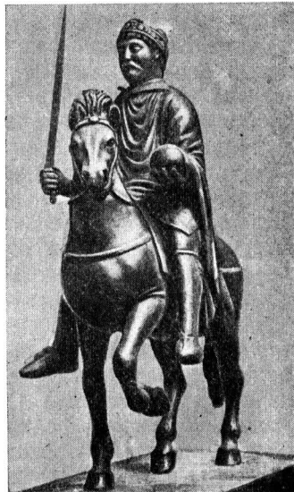
Карл Великий. Бронзовая статуэтка

Еще меньше были связаны с внешним рынком крестьянские хозяйства. Все свои скудные потребности крепостной крестьянин удовлетворял с помощью своего труда и своей семьи. Для труда на себя у него уже оставалось некоторое количество времени, что было несомненным прогрессом по сравнению с эпохой рабовладельческой эксплуатации. Он трудился не один, а со своей семьей. У него было побуждение трудиться упорнее, так как сеньеру не всегда удавалось отбирать у него весь избыточный продукт его труда. Произвол сеньера и тяжесть сеньериальной эксплуатации можно было сносить несколько легче, чем при рабстве, ибо теперь крестьянин противостоял господину