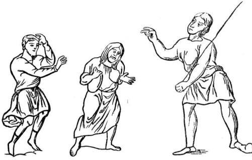
Крепостные VII—IX вв., приносящие клятву верности

она рано или поздно из свободной крепостную общину.