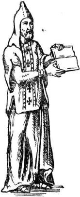
Бенедиктинский монах. С миниатюры VII в.

также расхищения государственного или королевского имущества.