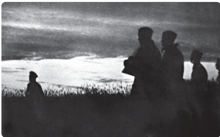
Перед вторжением. Раннее утро 22 июня 1941 г.

Профессор Боннского университета Х.А. Якобсон в одном из своих интервью сказал: «...из многочисленных архивных материалов и из личных бесед с самим Гальдером я вынес убеждение, что Гитлер вовсе не исходил из того, что "русские окажут немцам любезность", напав первыми» 1 .