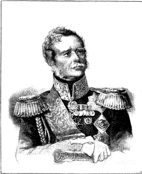
Графъ ПАСКЕВИЧЪ ЭРИВАНСКІЙ.

слѣдующій же день, 1 октября, начались большіе и значительно отличные отъ обычныхъ „линейныхъ передвиженій“ маневры, въ которыхъ приняли участіе полки 6 пѣх. и 2 гусар. дивизій *), получившіе названіе Ловичскаго отряда, во главѣ котораго былъ поставленъ ген.-отъ-кав. баронъ Крейцъ.