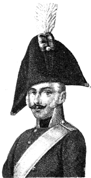
Рядовой 1801—1803 г.

Весною 1802 года полкъ получилъ новую форму обмундирования 2) : треугольныя шляпы съ бѣлыми султанами, двубортные свѣтло-зеленые мундиры съ синимъ стоячимъ воротникомъ и такого-же цвѣта обшлагами и