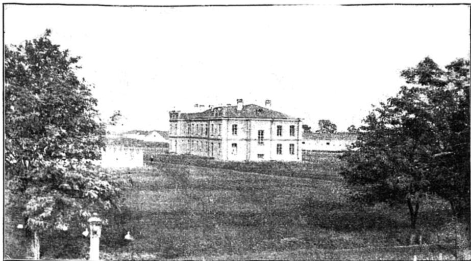
Казармы 1-го эскадрона въ городъ Грозномъ.