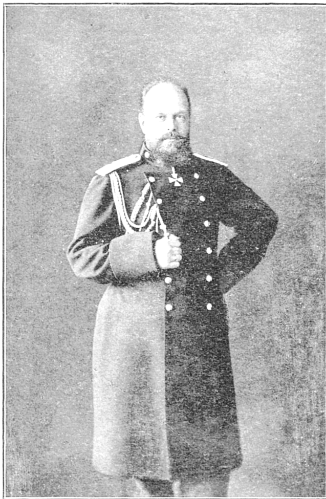
ИМПЕРАТОРЪ АЛЕКСАНДРЪ III, ШЕФЪ 46-го драгунскаго Переяславскаго ЕГО ВЕЛИЧЕСТВА полка. 1881 — 1894 г.