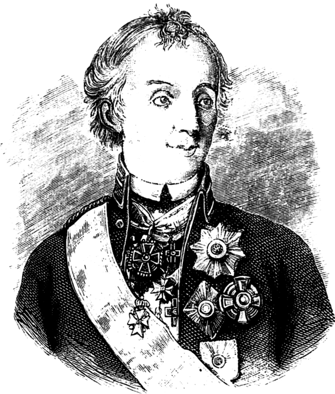
Генералиссимусъ кн. Италійскій, гр. А. В. Суворовъ-Рымникскій.

флангъ побудило Румянцева соединить отряды Потемкина и Баура въ одинъ подъ общимъ начальствомъ этого послѣдняго *). Затѣмъ вся наша армія приблизилась 5 іюля къ позиціи турокъ; слѣдующій день былъ проведенъ въ приготовленіяхъ къ атакѣ; при этомъ войска Потемкина