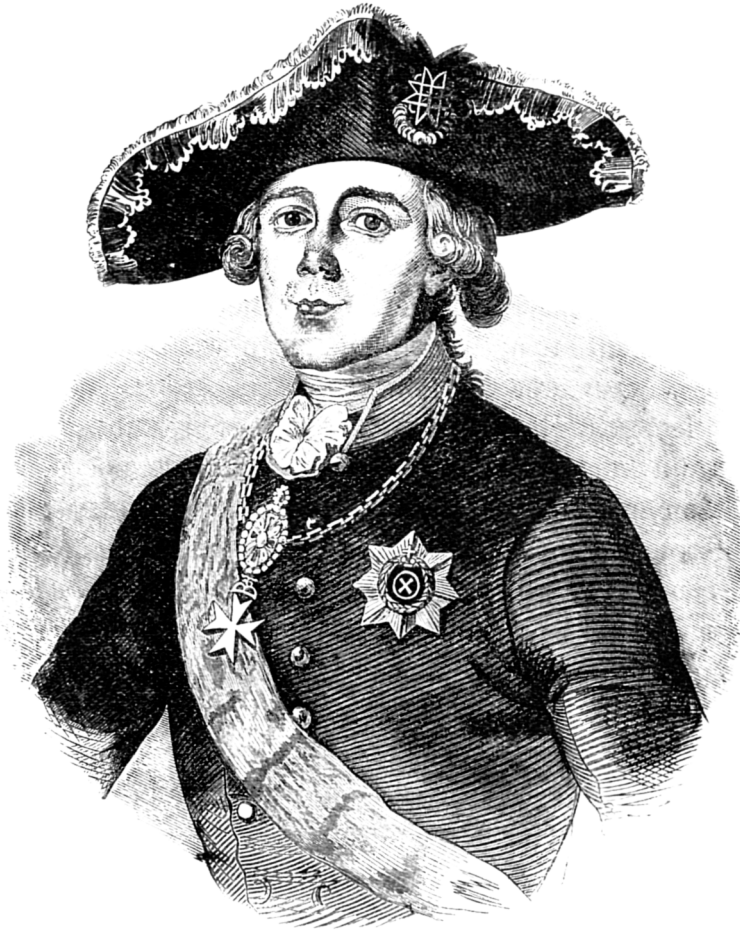
Императоръ ПАВЕЛЪ I-й.

Къ этому времени, противникъ былъ еще далеко и