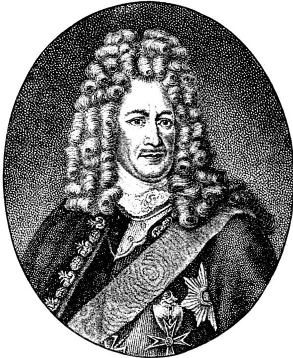
Свѣтлѣйшій князь Меньшиковъ.

Вскорѣ послѣ этого насталъ перерывъ въ военныхъ дѣйствіяхъ, обусловленный раннимъ таяніемъ снѣговъ. Перерывъ этотъ продолжался до мая. Выработанный же къ этому времени планъ дѣйствій заключался въ слѣдующемъ: въ операціи галернаго флота съ десантнымъ отрядомъ по