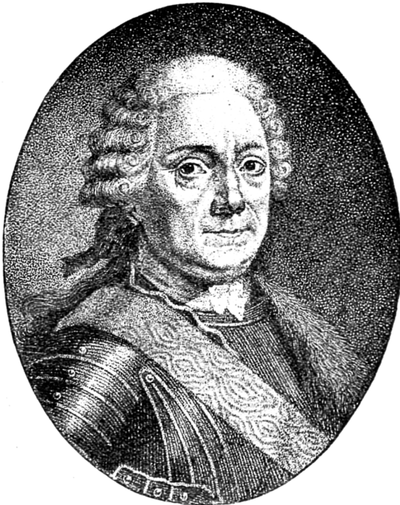
Графъ . J A C C H.

верховьяхъ р. Омельникъ, гдѣ былъ общій сборный пунктъ всей арміи. Въ это время Архангелогородскій полкъ, подъ командою полковника Эллера и при числовомъ составѣ въ 1686 чел., вошелъ въ составъ 3-й дивизіи г.-л. Карла фонъ-Бирона. Въ лагерь на Омельникѣ армія сосредоточилась и при этомъ, согласно плана кампаніи, предпола-