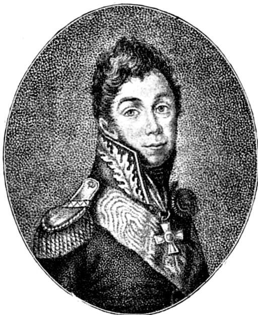
Шефъ полка графъ Н. М. Каменскій.