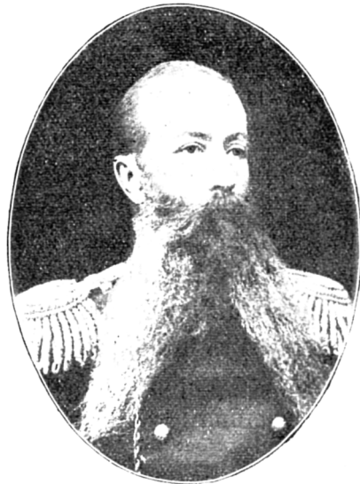
Полковникъ ДУБОВЪ. командир. полка 1868—1873.

Послѣ полкового компонента **), Архангелогородцы должны были передвинуться къ 1 іюлю въ Варшаву для участія тамъ въ лагерномъ сборѣ. Въ теченіи послѣдняго обращено было особенное вниманіе на стрѣльковое образованіе нижнихъ чиновъ, бла-