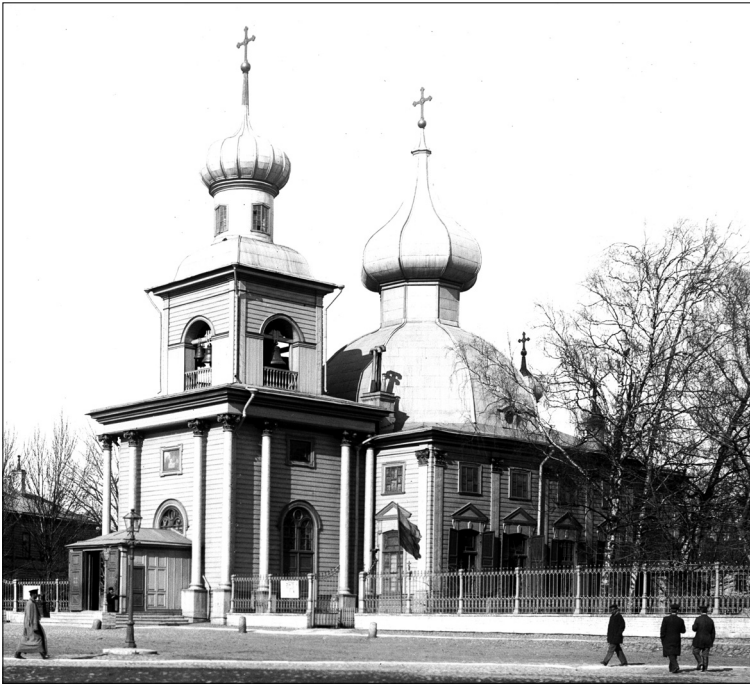
Троице-Петровский собор на Петербургской стороне, уничтоженный в 1934 год

ся немного легче» оттого, что этот голос прозвучал в те далекие и страшные 1930-е годы.