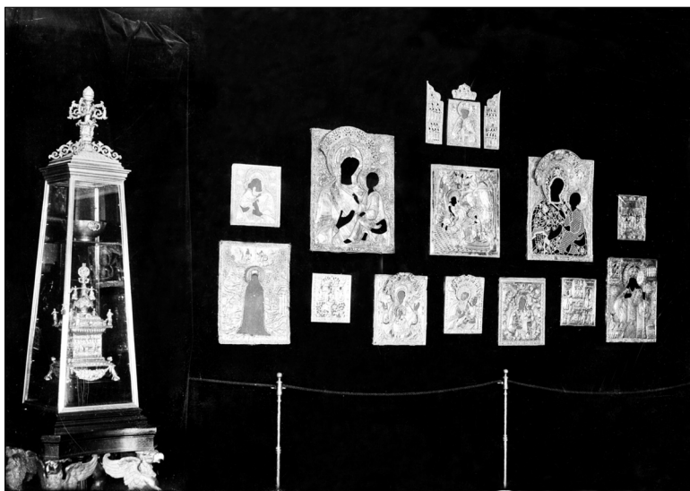
Временная выставка церковных памятников, изъятых комиссией «Помгол». Петроград, 1922 год

Но в 1920–1930-е годы памятникам городской архитектуры грозила и другая опасность, еще большая, чем та, которая шла со стороны «несознательной части населения». В 1925 году была закончена разработка плана «Новая Москва», предусматривавшего существенную реконструкцию центральных районов столицы со сносом ряда старинных зданий и сооружений. Речь шла, в частности, о сносе каменных домов XVII века, находящихся в свое время в усадьбах князей Голицыных и Троекуровых (эти дома стояли на участке между Тверской улицей и Большой Дмитровкой, против Охотного ряда). 9 октября 1925 года Музейный отдел Главнауки попросил руководство Академии наук «высказать свое мнение по данному делу и, в случае принятия решения, в пользу защиты указанных исторических памятников направить соответственное представление в Моссовет, а также в иные высшие правительственные органы, по своему усмотрению» 99 . Руководство Академии, в свою очередь, попросило председателя ПИК академика С. Ф. Платонова дать письменное заключение по этому вопросу. С. Ф. Платонов в своем письме