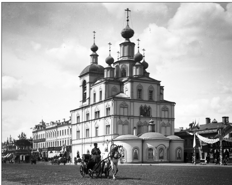
Церковь Параскевы в Охотном ряду в Москве, снесенная в 1928 г.

Руководство Академии выступило с решительными возражениями против развернувшейся в стране в конце 1920-х годов продажи за границу музейных ценностей. В мае 1928 года непременным секретарем С. Ф. Ольденбургом были направлены в ряд правительственных органов письма, в которых выражался протест против подобных акций, в частности, письма были адресованы наркому внешней и внутренней торговли СССР А. И. Микояну, наркому просвещения СССР А. В. Луначарскому, секретарю ЦИК СССР А. С. Енукидзе 107 . Сергей Федорович резонно отметил в упомянутых письмах: «Материальная польза, извлекаемая от продажи указанных объектов, весьма невелика. Речь идет, в конце концов, о сравнительно очень скромных суммах, которые, конечно, не могут явиться сколько-нибудь существенной поддержкой наших государственных ресурсов». Он пытался убедить руководителей государства в том, что «дело это слишком важное и слишком больно отражающееся на наших культурных интересах. Вот почему я и решаюсь привлечь к нему Ваше внимание, тем более