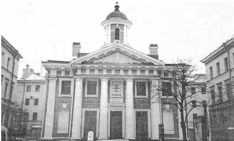
Финская церковь Св. Марии. Современная фотография

полтора лет новые отделения были основаны в Девяткино, Славянке, Кипени, Стрельне, Парголово — Юкки, а также за пределами собственно Ингрии — в Выборге и Приозерске. 297 В Карелии и Эстонии действуют соответственно пять и 11 местных отделений.