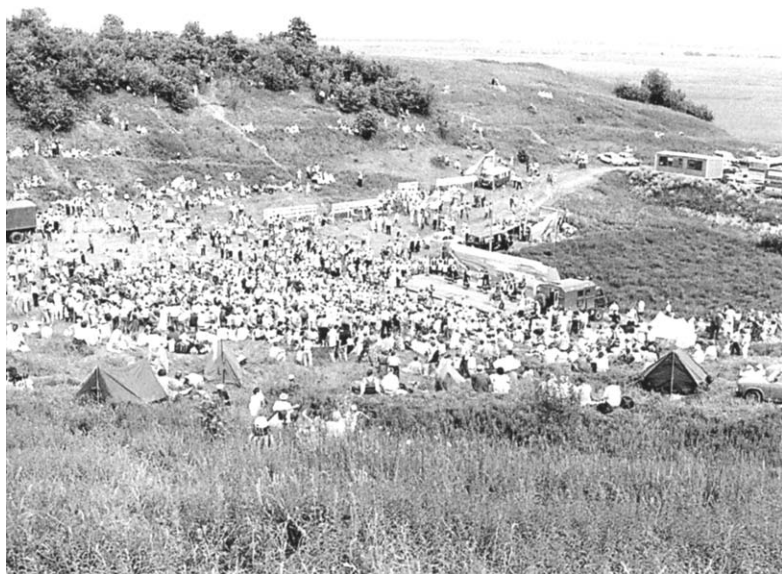
Празднование Юханнуса (Иванова дня) в Дудергофе, 1992 г.

стало предоставляться ингерманландцам только в 1954 г. Этот процесс растянулся на довольно длительный период, некоторые ингерманландцы не имели гражданских прав вплоть до 1970-х гг. Деятельность ингерманландских объединений в Финляндии, запрещенная после заключения советско-финляндского перемирия в 1944 г., начала возрождаться в 1950-е гг. В 1956 г. в Ярвенпяя на юге Финляндии был проведен летний ингерманландский праздник, а с 1958 г. начал выходить журнал «Инкерилэйстен вiesti» («Inkeriläisten viesti» — «Ингерманландские известия»). 282 В июне 1965 г. был образован «Ингерманландский образовательный фонд» (Inkeriläisten Sivistyssäätiö), устав которого был утвержден Министерством юстиции Финляндии 27 июля того же года. 283 Деятелями фонда был подготовлен и издан в 1969 г. сборник «История ингерманландских финнов» (Inkerin suomalaisten historia) — первая крупная работа по ингерманландской истории.