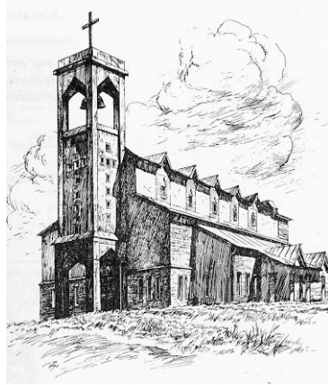
Новое здание церкви в Колтушах