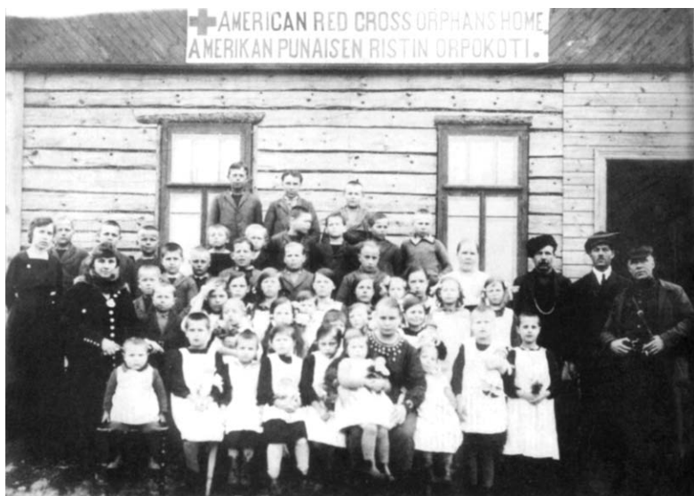
Ингерманландский детский дом в Рауту, 1920 г.