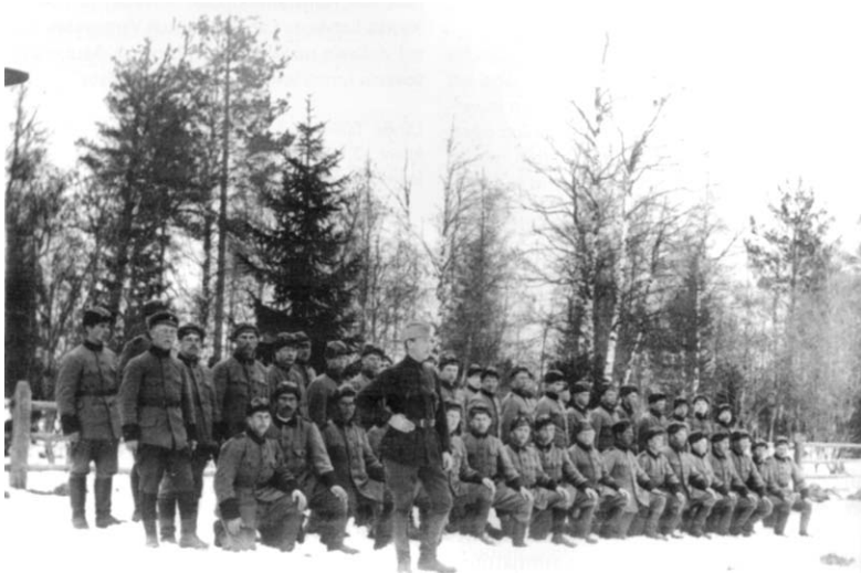
Бойцы Северо-ингерманландского полка, зима 1920 г.

Западной Ингрии, между реками Лугой и Наровой. 365 Небольшая часть Ямбургского уезда Петроградской губернии, отошедшая к Эстонии, в последующие годы была известна как Эстонская Ингерманландия. 366 На этой территории находилось 11 населенных пунктов, в которых проживали около 1800 человек, из них около половины — эстонцы, финны и ижоры. 367 Из примерно 2000 ингерманландских финнов и ижор, бежавших во время войны в Эстонию, большинство после заключения Тартуского мира вернулось в Россию или уехало в Финляндию; 368 в то