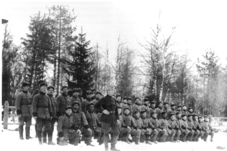
Вывод Ингерманландского полка из Кирьясало в Финляндию, 5 декабря 1920 г.