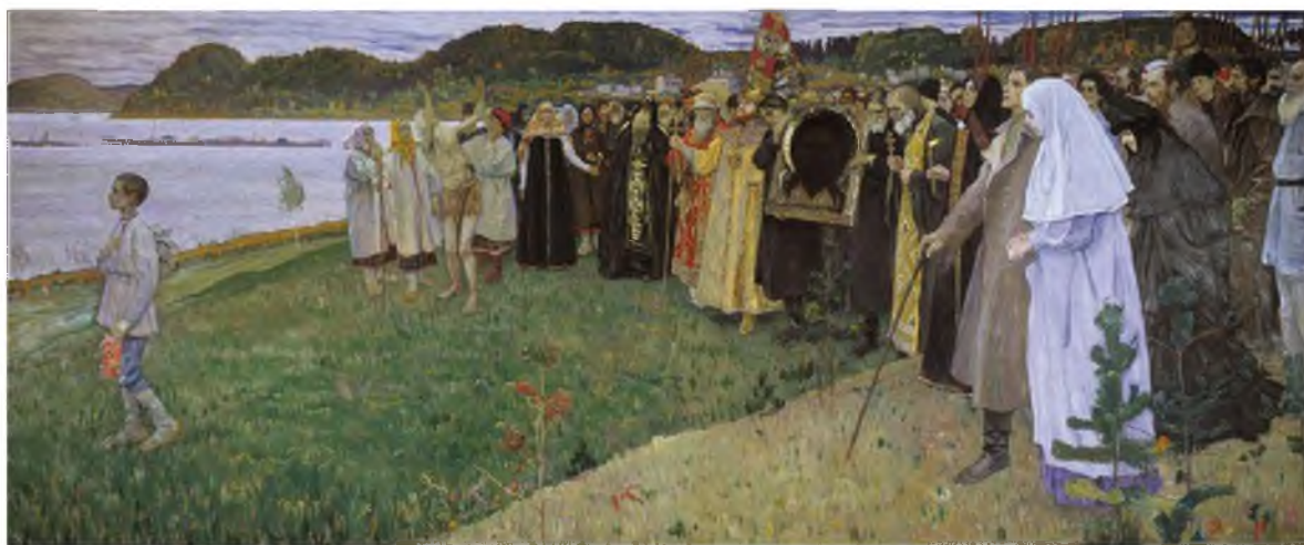
На Руси (Душа народа)

Параллельно с утопичной справедливостью сформировался стереотип «двоемыслия» как продукт повторявшихся суровых