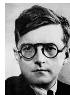
Ольга Берггольц и Дмитрий Шостакович.