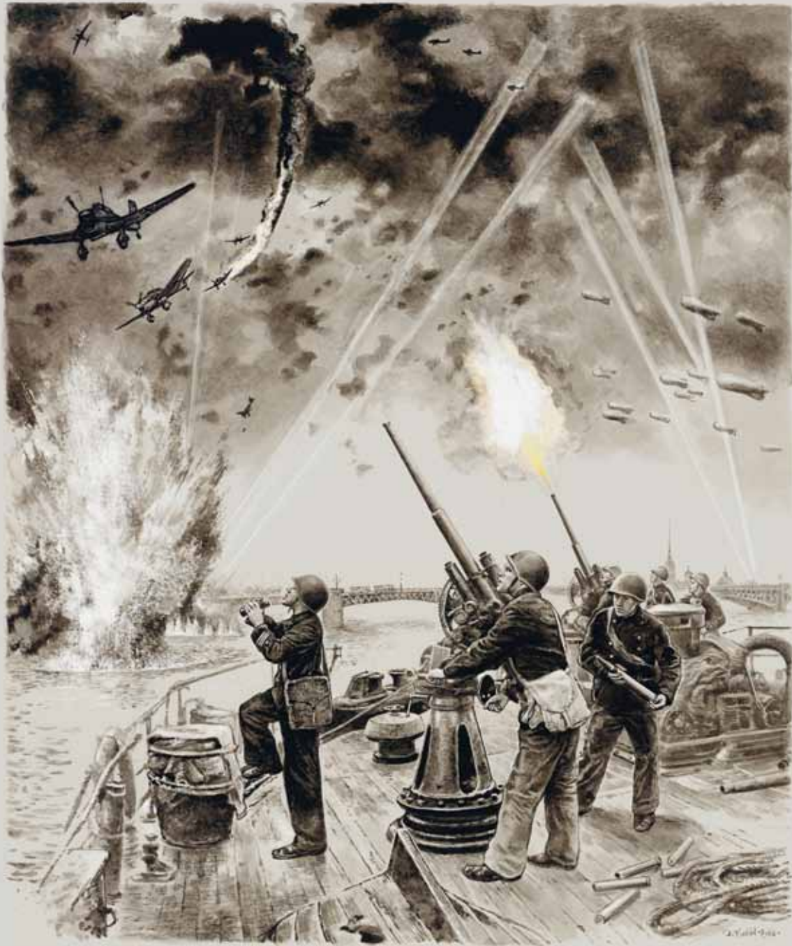
Боевые корабли Балтийского флота, пришвартованные в центре Ленинграда, действовали как зенитные батареи. Немцы применяли против города и наших кораблей и пикирующие бомбардировщики Ю-87.