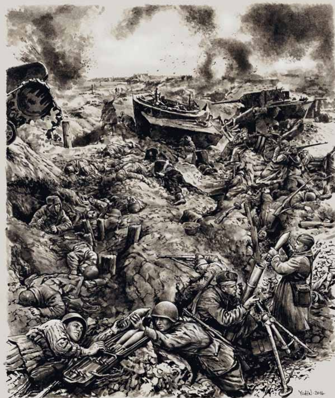
Каждая пядь земли на Невском пятачке была перепахана минами и снарядами, нашпигована сталью и свинцом. Бойцы дрались за каждый метр плацдарма.

К январю 1942 года казалось, что немецкая армия замерзает на русских морозах, отказывает немецкое оружие, не заводятся танки, грузовики и самолеты. Казалось, что контрнаступление Красной армии под Москвой поставило врага на грань катастрофы. Поэтому