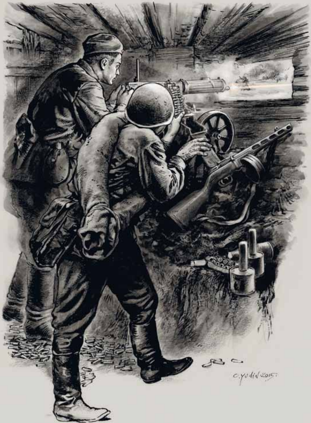
Ополченцы ведут огонь из дерево-земляной огневой точки. Такие ДЗОТ строились на Лужском рубеже, в Красногвардейском укрепрайоне и в самом городе.

Нацистская Германия хотела уничтожить нашу страну, народ, наш язык, песни и сказки. Народам России была уготовлена участь рабов. Нацисты хотели забрать для себя самые хорошие земли на юге, нефть на Кавказе, захватить и разрушить все наши города.