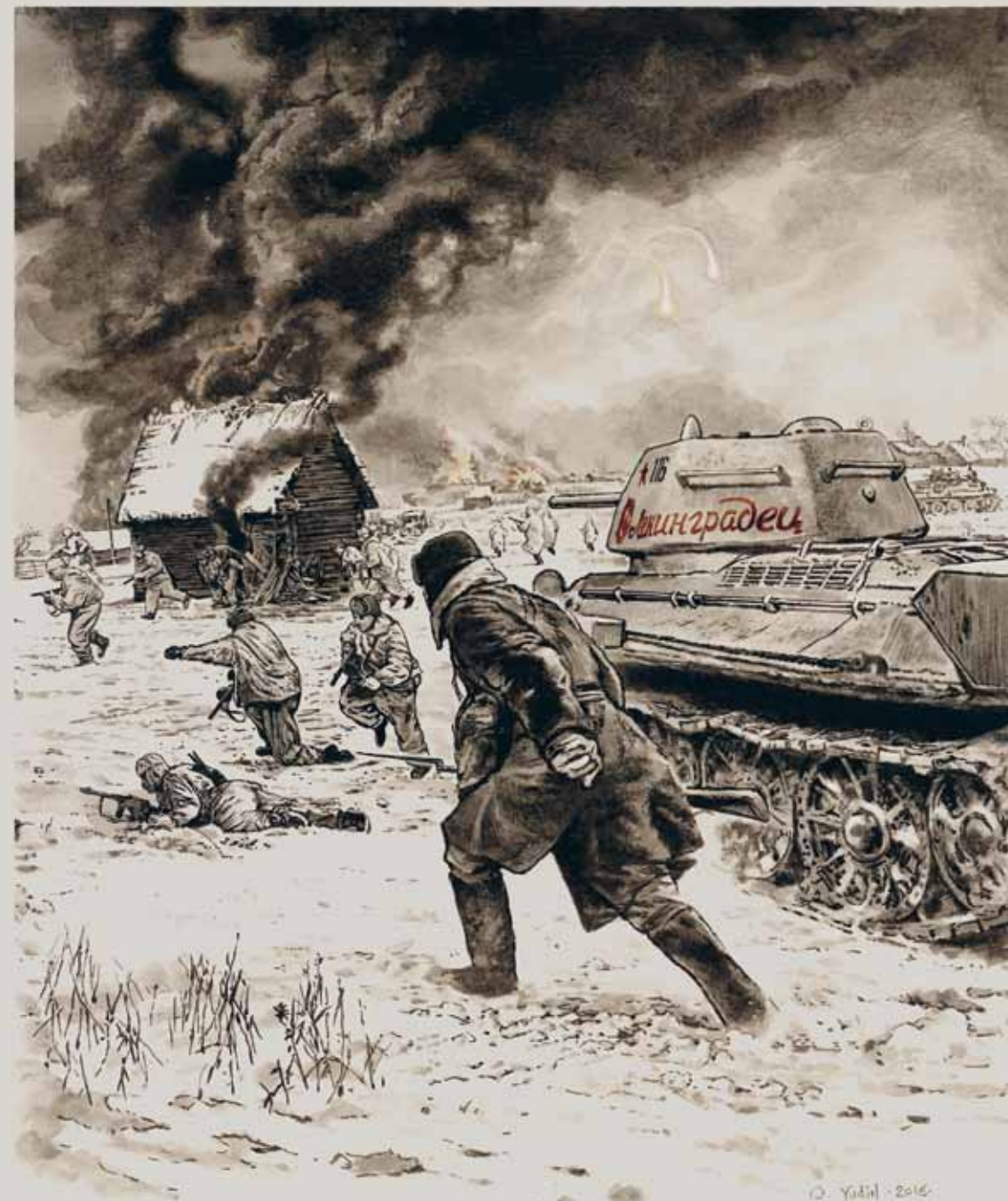
При отступлении в январе 1944 года немцы старались сжигать все деревни вместе с жителями на своем пути. Часто наши наступающие части врываются в деревни на плечах факельных команд и спасали мирное население от гибели.

Две недели спустя гитлеровцев уже отодвинули к границе с Прибалтикой. Однако весной 1944 года взломать немецкую оборону на реке Нарва не удалось. Немцы были все еще сильны и сумели