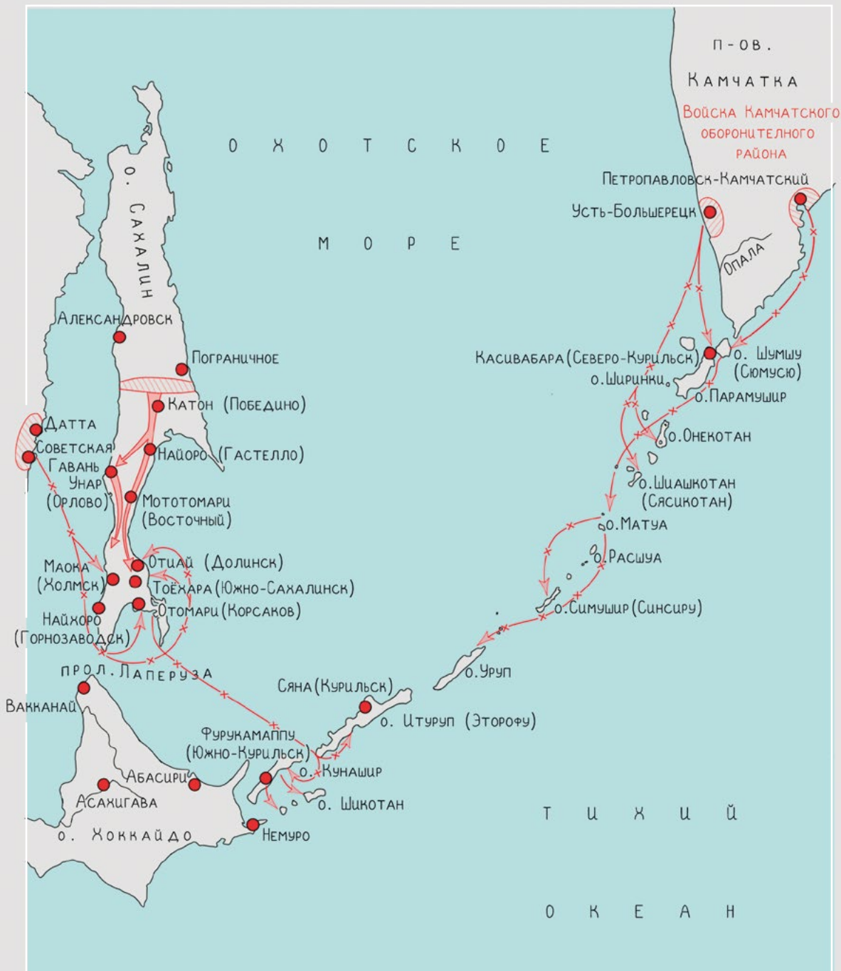
Курильская десантная операция 18 августа — 1 сентября 1945 года.