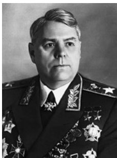
А. М. ВАСИЛЕВСКИЙ Маршал Советского Союза. Главкомандующий советскими войсками на Дальнем Востоке.