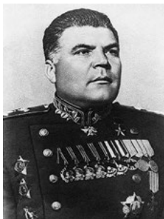
Р. Я. МАЛИНОВСКИЙ Маршал Советского Союза. Командующий Забайкальским фронтом.