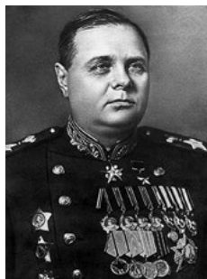
К. А. МЕРЕЦКОВ Маршал Советского Союза. Командующий 1-м Дальневосточным фронтом.