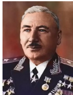
И. А. ПЛИЕВ Генерал-полковник, командующий советско-монгольской КМГ. За Маньчжурскую операцию получил вторую Золотую Звезду Героя.