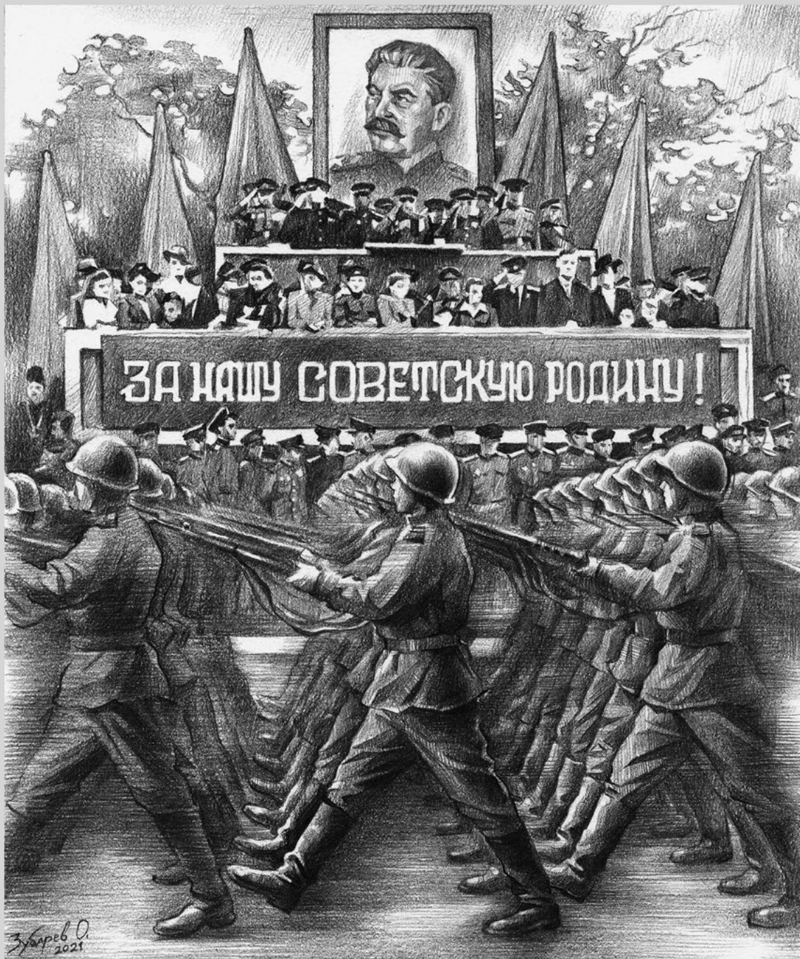
Парад Победы на Дальнем Востоке состоялся в Харбине. На него были приглашены и представители русской общины Харбина, включая представителей Русской православной церкви.