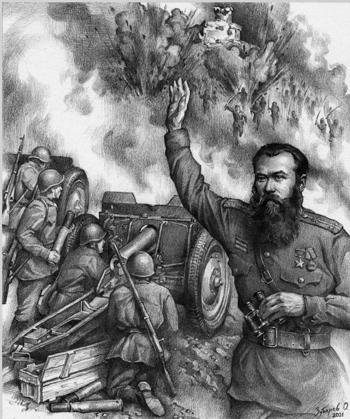
Бой в Хайларском укрепрайоне. Батарея Героя Советского Союза капитана Ковтуна отражает атаку японских смертников огнём прямой наводкой картечью. Капитан Ковтун был ранен в лицо и носил большую бороду, чтобы скрыть увечья.