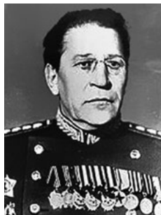
М. А. ПУРКАЕВ Генерал армии. Командующий 2-м Дальневосточным фронтом.

Наступление велось на огромном пространстве, по размерам сравнимом со всей Европой. Между советскими ударными группировками на материке было около 3000 километров! Замысел советского наступления был грандиозным: окружить всю группировку противника в Маньчжурии ударами с трёх направлений и заставить её капитулировать, не дав эвакуироваться в Японию из портов Китая и Кореи.