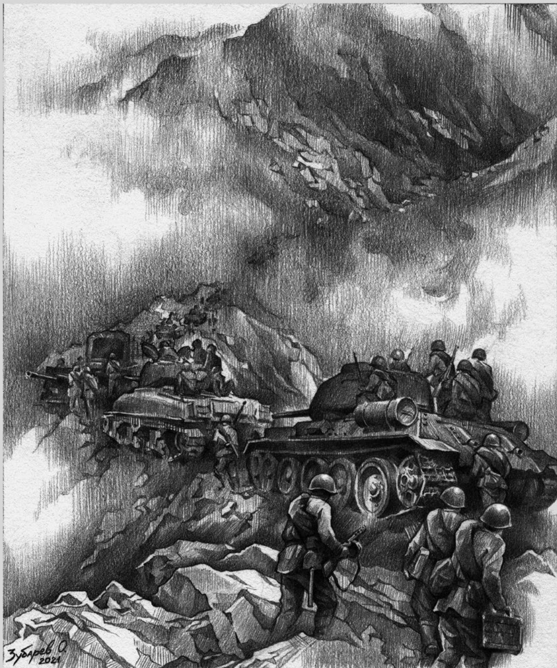
Марш через Хинганские горы.