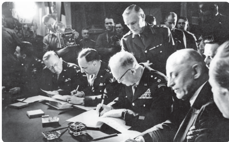
Д. Эйзенхауэр подписывает Декларацию о поражении нацистской Германии. Берлин. 5 июня 1945 г.

4. Этот акт не будет являться препятствием к замене его другим генеральным документом о капитуляции, заключенным Объединенными Нациями или от их имени, применимым к Германии и германским вооруженным силам в целом.