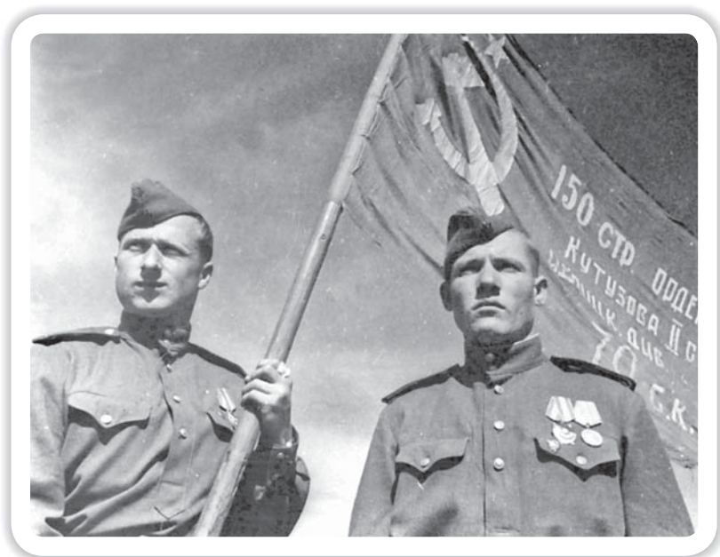
М. Егоров и М. Кантария со Знаменем Победы. 1945 г.