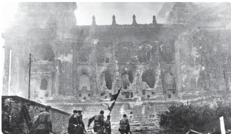
Штурм Рейхстага. Берлин. 1945 г.

такое убеждение у каждого из нас в самом начале штурма, когда еще не вполне представлялось, какое сопротивление способен оказать противник. Вот и полетели по команде донесения. Ведь всем так хотелось быть первыми!» 1 К Рейхстагу устремились военные кинооператоры, фотокорреспонденты, журналисты. Однако штурмующие батальоны по-прежнему вели бои на подступах к зданию, где ни одного советского солдата и ни одного флага не было.