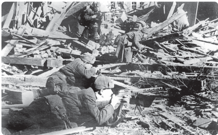
Уличные бои в Берлине. Апрель 1945 г.

решил повернуться спиной к англо-американским войскам, а все усилия сосредоточить на удержании Берлина. Прекращая сопротивление на западе, Гитлер намеревался создать благоприятную почву для соглашения с англо-американским руководством. Как заявил генерал Йодль начальнику штаба люфтваффе генералу К. Коллеру в личной беседе 23 апреля, «совсем безразлично, что при этом предпримут американцы на Эльбе. Может быть, удастся доказать этим, что мы хотим воевать только против Советов» 1 .