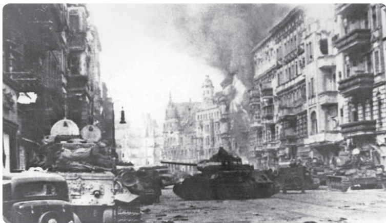
1-я гвардейская танковая бригада на улицах Берлина. 1945 г.

Исключительно ожесточенный характер носили бои по ликвидации 300-тысячной группировки противника, окруженной в самом городе. Главная задача 1-го Белорусского фронта, вместе с которым действовала часть войск 1-го Украинского, заключалась в штурме Берлина. Еще в начале марта Гитлер объявил его городом-крепостью, и теперь это был мощный оборонительный район.