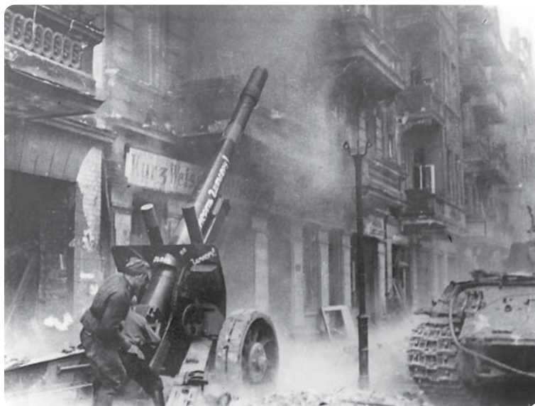
Артиллеристы и танкисты ведут бой в Берлине. 1945 г.

возможность развивать наступление непосредственно на Берлин. На темпы их наступления существенное влияние оказало то обстоятельство, что ударная группировка фронта развертывала наступление с небольшого по площади плацдарма и в сравнительно узкой полосе, ограниченной водными преградами и лесисто-болотистыми районами. Это стесняло ее маневр и не позволяло быстро расширить полосу прорыва. К тому же переправы и тыловые дороги были чрезвычайно перегружены, что крайне затрудняло ввод в сражение новых сил из глубины.