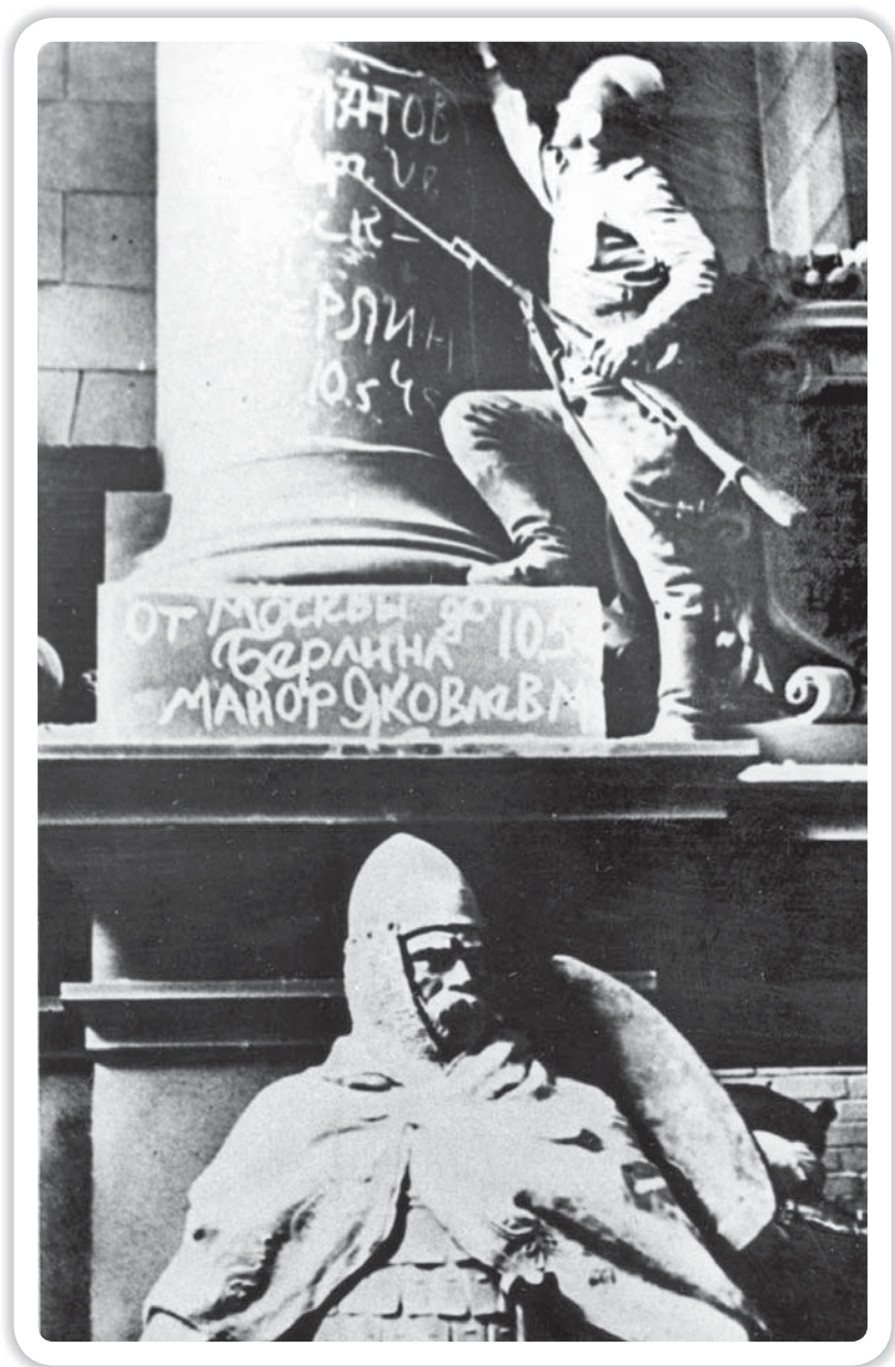
Роспись победителя на колонне Рейхстага. Берлин. Май 1945 г.