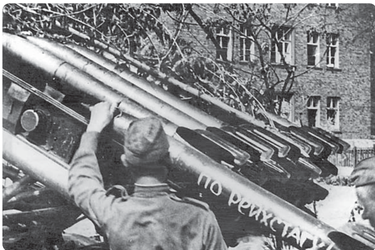
Катюши ведут огонь по Рейхстагу

ворвались в Рейхстаг и в 14 часов 25 минут водрузили красный флаг. Доклад дошел до И.В. Сталина. Последствия его были таковы: командующий войсками 1-го Белорусского фронта Г.К. Жуков оперативно издает приказ № 06 с объявлением благодарности командирам и бойцам — участникам штурма Рейхстага, которые «сломили сопротивление врага, заняли главное здание рейхстага и сегодня 30 апреля 1945 г. в 14.25 подняли на нем наш Советский флаг» 1 . Впоследствии, объясняя этот факт, командир 756-го стрелкового полка полковник Ф.М. Зинченко в своих воспоминаниях напишет, что «всеми виной поспешные, непроверенные донесения. Возможность их появления была не исключена. Бойцы подразделений, залегших перед Рейхстагом, несколько раз поднимались в атаку, пробивались вперед в одиночку и группами, вокруг все ревело и грохотало. Кому-то из командиров и могло показаться, что его бойцы если и не достигли, то вот-вот достигнут заветной цели. Особенно твердым было