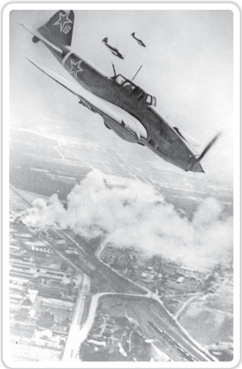
Советские штурмовики над Берлином. 1945 г.