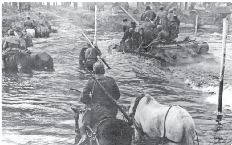
Советские части преодолевают р. Шпрее. 1945 г.

штаб, командующие, штабы и военные советы фронтов. Окончательный план Берлинской операции был утвержден Верховным главнокомандующим в начале апреля. Цель операции состояла в том, чтобы в короткие сроки разгромить основные силы групп армий «Висла» и «Центр», овладеть Берлином и, выйдя на реку Эльбу, соединиться с войсками западных союзников. Это должно было лишить Германию возможности дальнейшего организованного сопротивления и вынудить ее к безоговорочной капитуляции. Завершение разгрома немецких войск предполагалось осуществить совместно с западными союзниками, принципиальная договоренность с которыми по координации действий была достигнута на Крымской конференции.