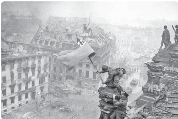
Советское знамя над Рейхстагом. Берлин. Апрель 1945 г.