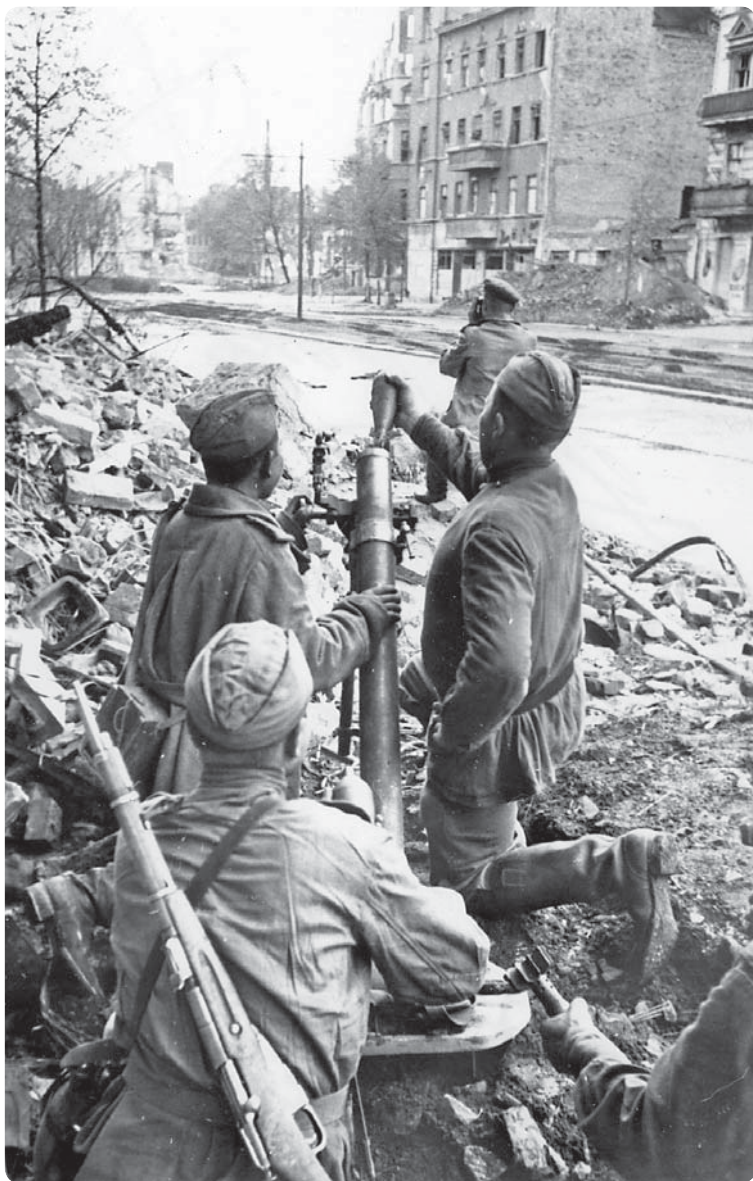
Минометчики ведут огонь по противнику. Берлин. Апрель 1945 г.