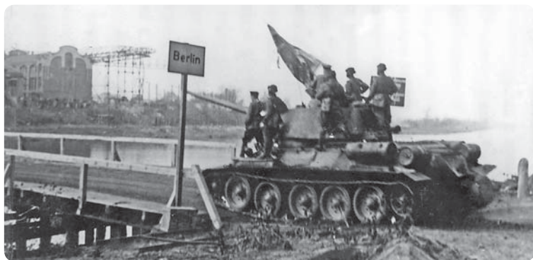
Танки 3-й гвардейской танковой армии переправляются через канал Тельтов. Берлин. Апрель 1945 г.

в инженерном отношении она была на Зееловских (Зеловских) высотах — перед кюстринским плацдармом. Третья полоса находилась на удалении 20–40 км от переднего края главной полосы. Как и вторая, она состояла из мощных узлов сопротивления, соединенных между собой траншеями и ходами сообщения. Не только перед передним краем оборонительных полос, но и в глубине были созданы многочисленные минные поля. Средняя плотность минирования на важнейших направлениях достигала 2 тыс. мин на 1 км фронта. Перед первой траншеей и в глубине обороны, особенно на пересечении дорог, располагались истребители танков, вооруженные фаустпатронами.