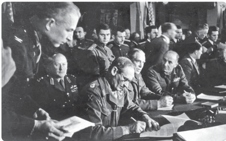
Б. Монтгомери подписывает Декларацию о поражении нацистской Германии. 5 июня 1945 г.

остатки германских войск в районе Данцига и Гдыни. В Норвегии капитулировала оперативная группа «Нарвик». Советский десант, начавший высадку 9 мая на датский остров Борнхольм, через два дня завершил прием немецких войск. Только на юго-западном участке советско-германского фронта войска группы армий «Центр» и «Австрия» по-прежнему пытались пробиться к американцам. 10 мая Д. Эйзенхауэр вынужден был отдать приказ, в соответствии с которым те германские военнослужащие, что нарушат акт о капитуляции и попытаются ускользнуть от Красной Армии, будут возвращены советскому командованию. Попытка фельдмаршала Шернера укрыться в американском плену закончилась неудачей: американцы передали его советскому командованию. Мелкие группы немцев на территории Чехословакии и Австрии пришлось уничтожать вплоть до 19 мая.