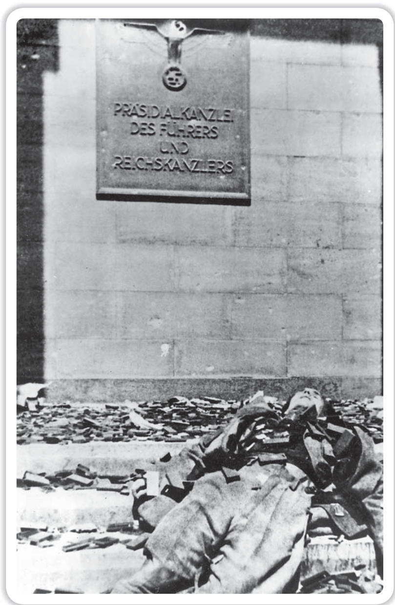
Берлин. Имперская канцелярия. Май 1945 г.