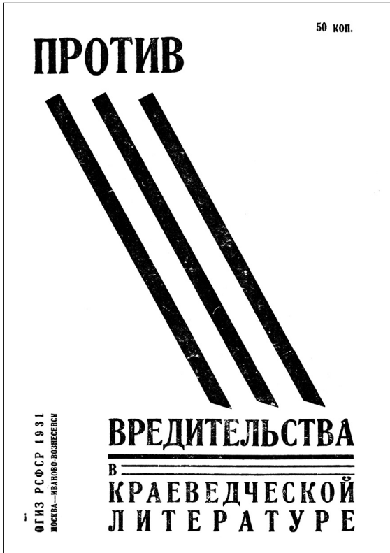
Титульный лист брошюры, изданной ОГИЗ РСФСР в 1931 году.

этом также подчеркивалось, что «разоблаченные буржуазные краеведы смыкались идеологически с группой Платонова–Букина–Веселовского и К» 111 .