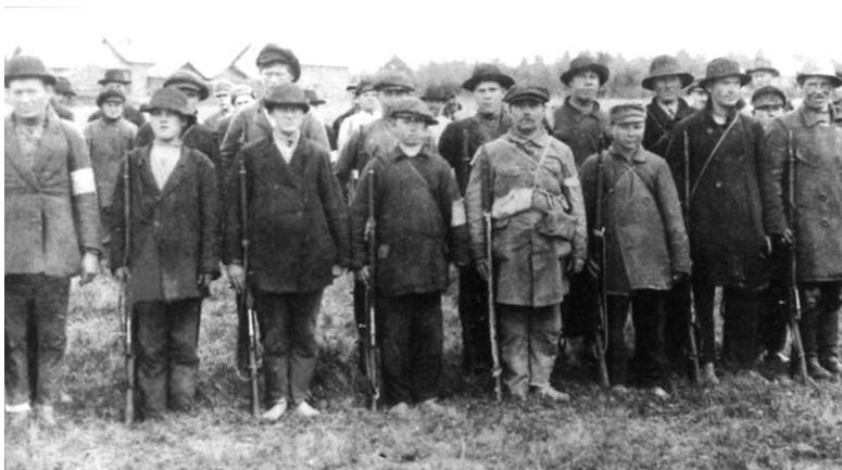
Бойцы Северо-ингерманландского добровольческого отряда, лето 1919 г.

местные предатели и большевики в последние дни принялись грабить ингерманландские деревни, реквизируют коров и лошадей, арестовывают и запугивают крестьян и беззащитных женщин, по тем же сведениям, некоторые деревни разграблены начисто». В этой связи надо принять «соответствующие военные меры, чтобы спасти то, что еще можно спасти». 247 В оправдание своих действий Эльвенгрен позднее утверждал, что бесчинства большевистских властей в приграничных ингерманландских деревнях вызвали возмущение ингерманландцев в Кирьясало и Рауту, ему было трудно сдерживать своих людей, поэтому он был вынужден дать приказ о наступлении. 248 Вполне вероятно, что новая волна репрессий в Северной Ингрии действительно оказала влияние на решение Эльвенгрена и его сподвижников начать вторжение. Чрезвычайная комиссия революционной охраны Карельского участка под председательством А. Тайми, созданная 6 июня по приказу Комитета обороны Петрограда, произвела основательную чистку «контрреволюционного и сомнительного элемента» в приграничной полосе; в частности, 77 человек были арестованы в качестве заложников, 72 — отправлены в концентрационные лагеря, 47 — переданы в Революционный трибунал по обвинению в дезертирстве, семеро были