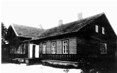
Здание учительской семинарии в дер. Колпаны