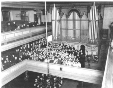
Интерьер финской церкви Св. Марии в Петербурге.

В конце XIX — начале XX вв. в Ингерманландии было основано значительное число народных школ. В одном только приходе Дудергоф — Хиетамяки в 1870-е гг. функционировали пять школ, народные школы работали также в приходах Колтуши, Токсово, Марково, Славянка (Венйоки), Ижора (Инкере), Шпаньково, Колпаны и Тюрё. 128 К 1911 г. в районах расселения ингерманландских финнов действовали 229 народных школ (74 в Царскосельском уезде, 54 — в Петергофском, 45 — в Шлиссельбургском, 30 — в Петербургском, 26 — в Ямбургском), в которых обучались 10 757 человек, 129 а к 1918 г. их количество увеличилось до 314. 130 Другим видом образовательных учреждений были воскресные школы, в которых основное внимание уделялось обучению родному языку, лютеранскому катехизису и священной истории. Первую такую школу основал пастор О.В. Ронканен в приходе Марково в 1874 г. Воскресные школы, наряду с детьми, посещали подчас и взрослые. К 1911 г. в финских приходах насчитывалось 566 воскресных школ, в