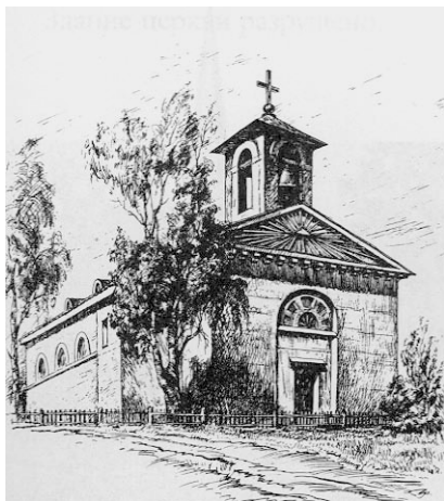
Церковь прихода Тюре

Царский двор и члены царской семьи оказывали местной лютеранской церкви значительную поддержку. Не в последнюю очередь это было связано с тем, что жены многих российских монархов до брака исповедовали лютеранство, а также с тем, что немало лютеран, в основном немцев, находилось на российской государственной службе. Русские государи неоднократно