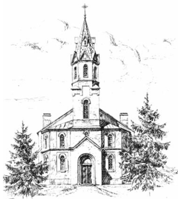
Церковь в Токсово