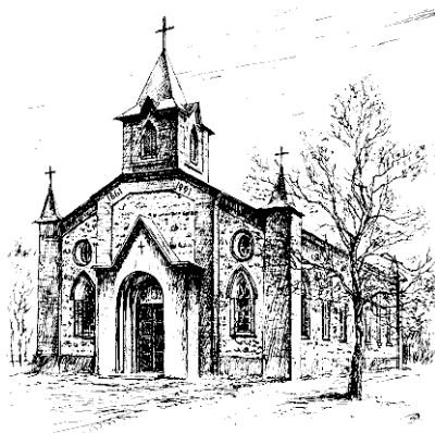
Церковь в Губаницах

Финских шхер. 100 В 1719 г. в городе был образован финско-шведский лютеранский приход Св. Анны. 101 В 1733 г. по указу императрицы Анны Иоанновны для этого прихода на Большой Конюшенной улице был выделен участок для постройки молитвенного здания, и здесь была построена новая деревянная церковь. В 1745 г. шведы образовали свой отдельный приход, для которого в 1767 г. на смежном участке на Малой Конюшенной улице была