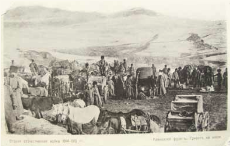
Отряд восточной армии 1914-1915 г.

и сильно истекал кровью. Раны были перевязаны какими-то грязными тряпками, и он несчастный от боли, холода и усталости стонал. Его тоже привели в околоток, где врач сделал ему промывку и перевязки, после чего подводой он был отправлен дальше. Одна женщина, не доходя до деревни с версту, разродилась от бремени мальчиком. Она сняла с себя последнюю теплую одежду и закутала новорожденного. Сама бледная, измученная, с ребёнком на руках еле дотащилась до конца деревни. Здесь у неё взяли ребёнка наши солдаты и под руки довели больную в околоток. Здесь врач оказал ей помощь. Сшили на скоро для ребёнка одежду и через два дня её проводили подводой. Приходилось видеть часто группы детей по 20-25 человек разных возрастов и пола. Все без родителей, одни, кричат, плачут и некому помочь и услышать их... Одно их спасало — пребывание русских войск, много сочувствовавших их спасению. Все от мала до велика просят Бога о скорой победе Русским Войском, и все смотрят на Россию, как единственную их спасительницу от постоянных зверств варваров.