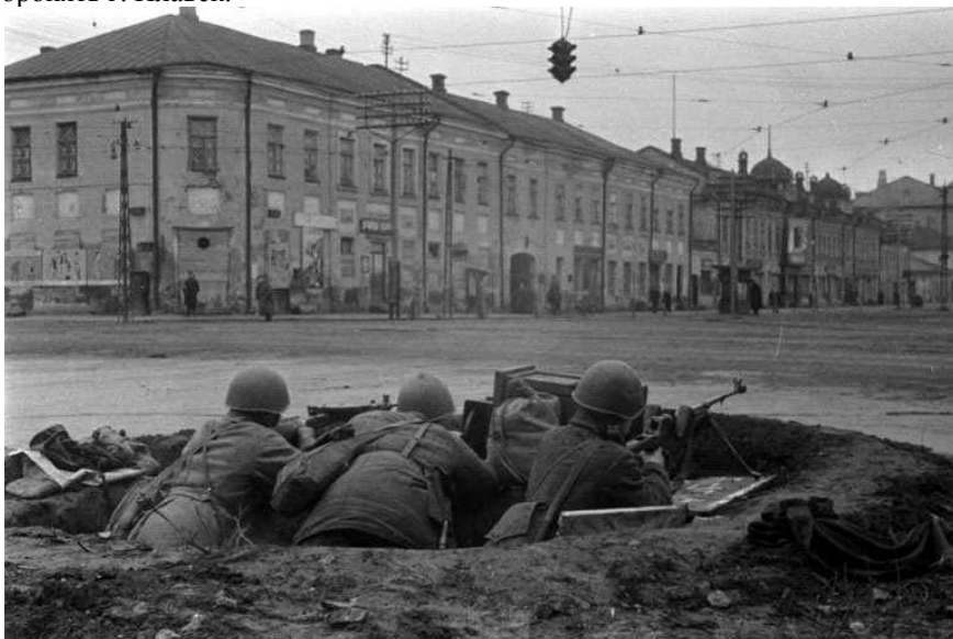
Тула, перекресток улиц Советской и Коммунаров. Октябрь 1941 г.