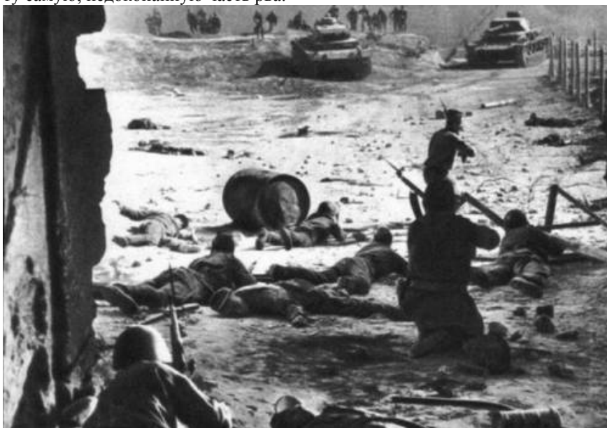
Танковая атака врага

В 6 часов утра 30 октября 20 немецких бомбардировщиков начали утюжить передний край обороны, затем началась артподготовка. Весь передний край нашей обороны и места разведанных с вечера огневых точек были перепажаны артиллерией противника. Потом в атаку пошли 20 танков прямо по Орловскому шоссе, но самая мощная группировка в 34 танка с пехотой атаковали позиции Тульского рабочего полка со стороны д. Гостеевка, через ту самую, недокопанную часть рва.