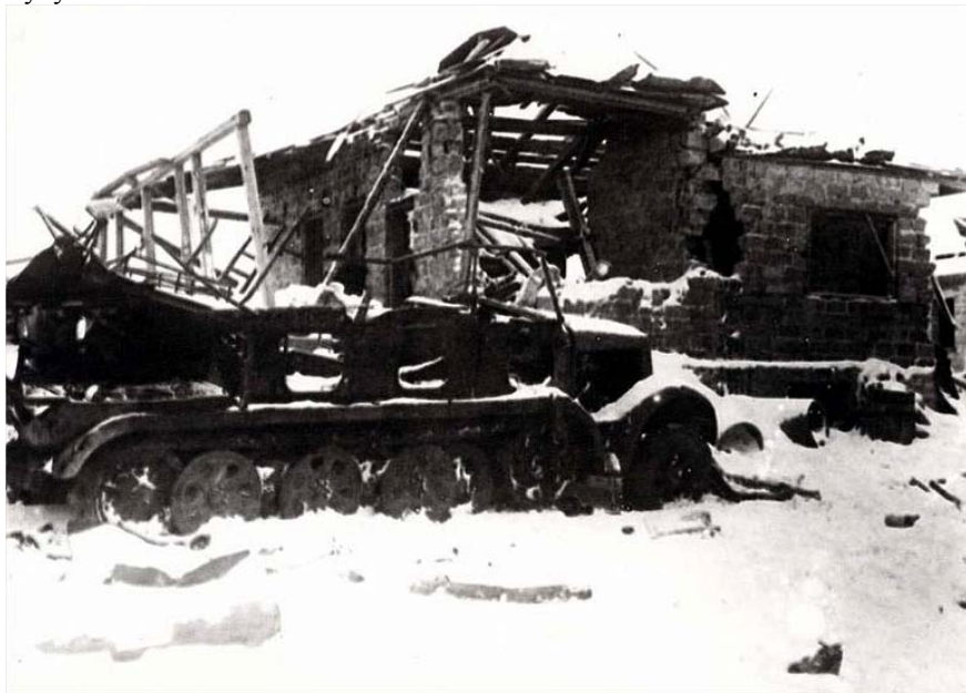
В освобожденном поселке Косая Гора

Наступление на Тулу было сорвано. Немецкие командиры изменили свой план. Было решено Тулу пока не захватывать, а нанести удар в районе Деделово в направлении г. Венев. Затем часть сил наносили удар на Каширю, а другая часть сил от Венева наносила удар на Запад с целью окружить Тулу.