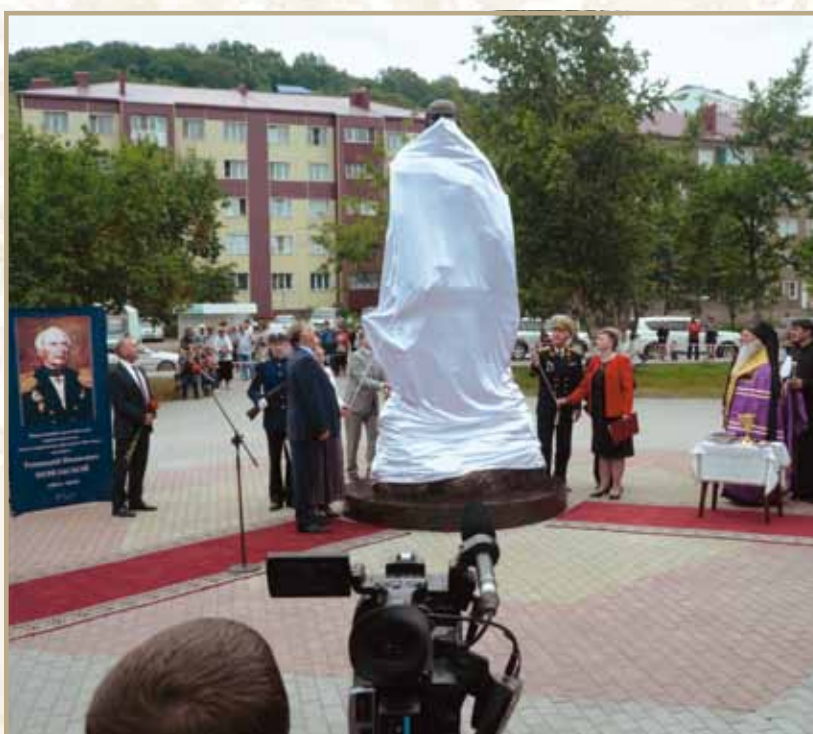
Ил. 22. Открытие памятника Г.И. Невельскому в Комсомольском сквере в г. Корсакове, 20 июля 2013 года

Автор Альберт Чаркин (Санкт-Петербург). Полуфигура в бронзе высотой 1,75 метра на гранитном постаменте высотой 1,8 метра, плита диаметром 2 метра, высотой 0,15 метра. Сооружен на средства межрегионального общественного фонда содействия укреплению самосознания народа «Центр национальной славы»