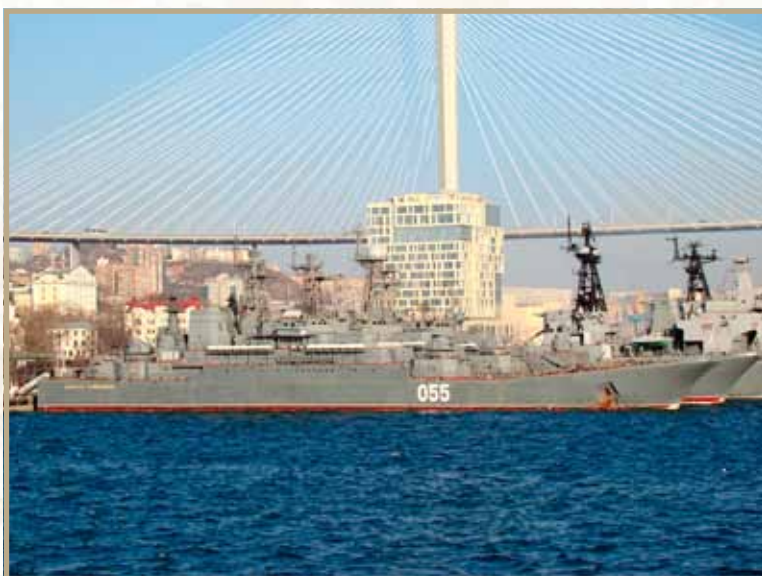
Ил. 23. Большой десантный корабль (БДК) «Адмирал Невельской». Бортовой номер 055. Японское море, залив Петра Великого, бухта Золотой Рог. Приморский край, Владивосток, 33-й причал

Летом 2011 года, накануне Дня Военно-морского флота, на 33-м причале Корабельной набережной Владивостока состоялась торжественная церемония наречения большого десантного корабля БДК-98 Тихоокеанского флота именем мореплавателя и первооткрывателя Геннадия Ивановича Невельского.