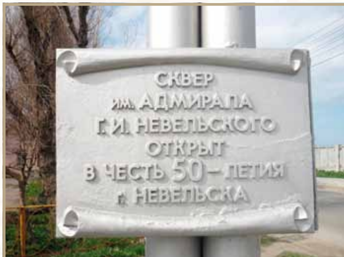
Ил. 19. Сквер имени адмирала Г.И. Невельского в г. Невельске Сахалинской области