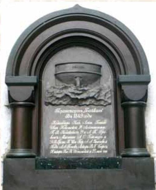
Ил. 11. Бронзовая доска с изображением кормовой части транспорта «Байкал» с надписями и перечислением участников экспедиции 1849 года