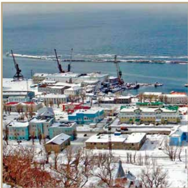
Ил. 2. Город Невельск. Зимний вид на морской порт (снимок не ранее 2010 года)