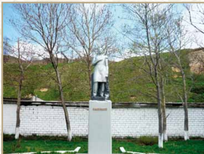
Ил. 20. Памятник Г.И. Невельскому в г. Невельске, у Сахалинского морского колледжа

Скульптор Г. Шкловский, архитектор И. Будылдин.