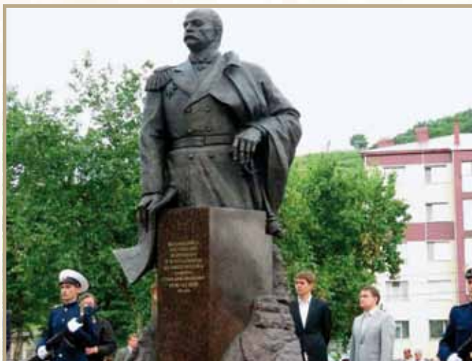
Ил. 21. Морской караул у памятника Г.И. Невельскому в день открытия в г. Корсакове, 20 июля 2013 года