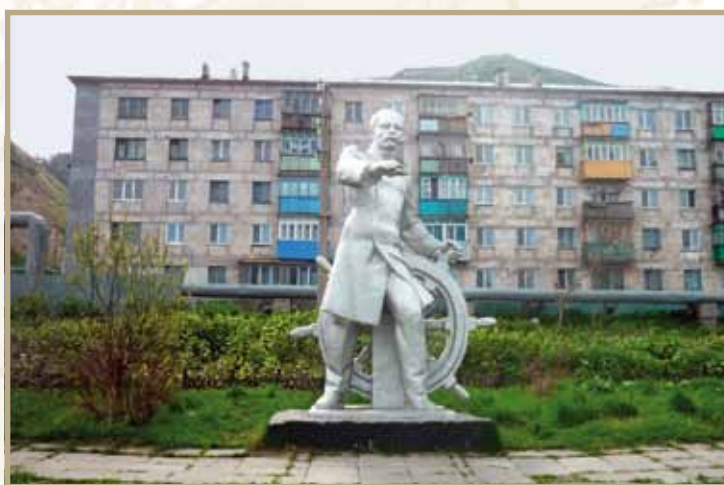
Ил. 18. Памятник Г.И. Невельскому в сквере его имени в г. Невельске Скульптор К. Багдасаров. Бронза. Открыт в 1996 году в честь 50-летия со дня присвоения городу имени Невельского (Указ Президиума Верховного Совета РСФСР от 5 июня 1946 года)

Проект Николая Кондырева Литейщик мастерских ДВВИМУ Юрий Федоренко Фото С. Пономарёва, 2009 год