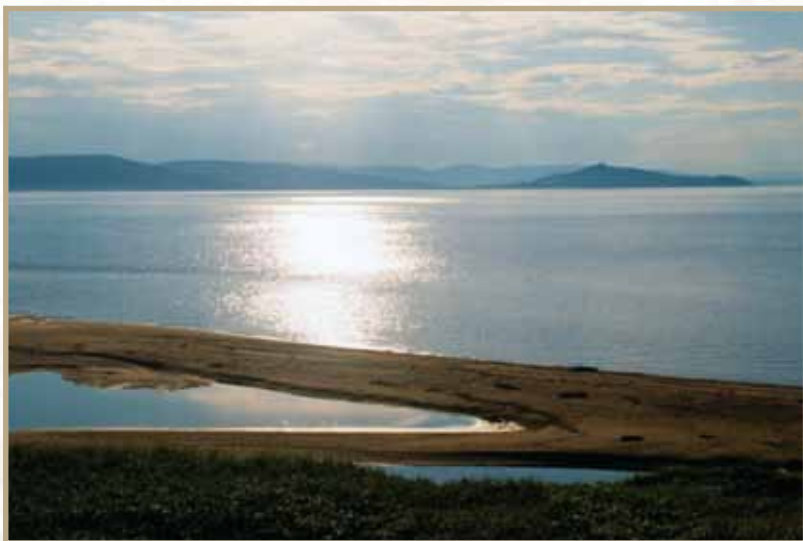
Ил. 5, 6. Пролив Невельского