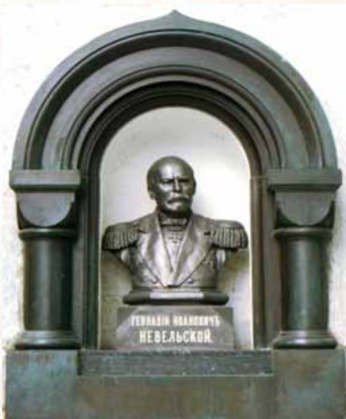
Ил. 10. Бюст Г.И. Невельского в нише у основания монумента, г. Владивосток

Скульптор Роберт Бах, 1897 год. Бронза, с 2001 года — полимербетон