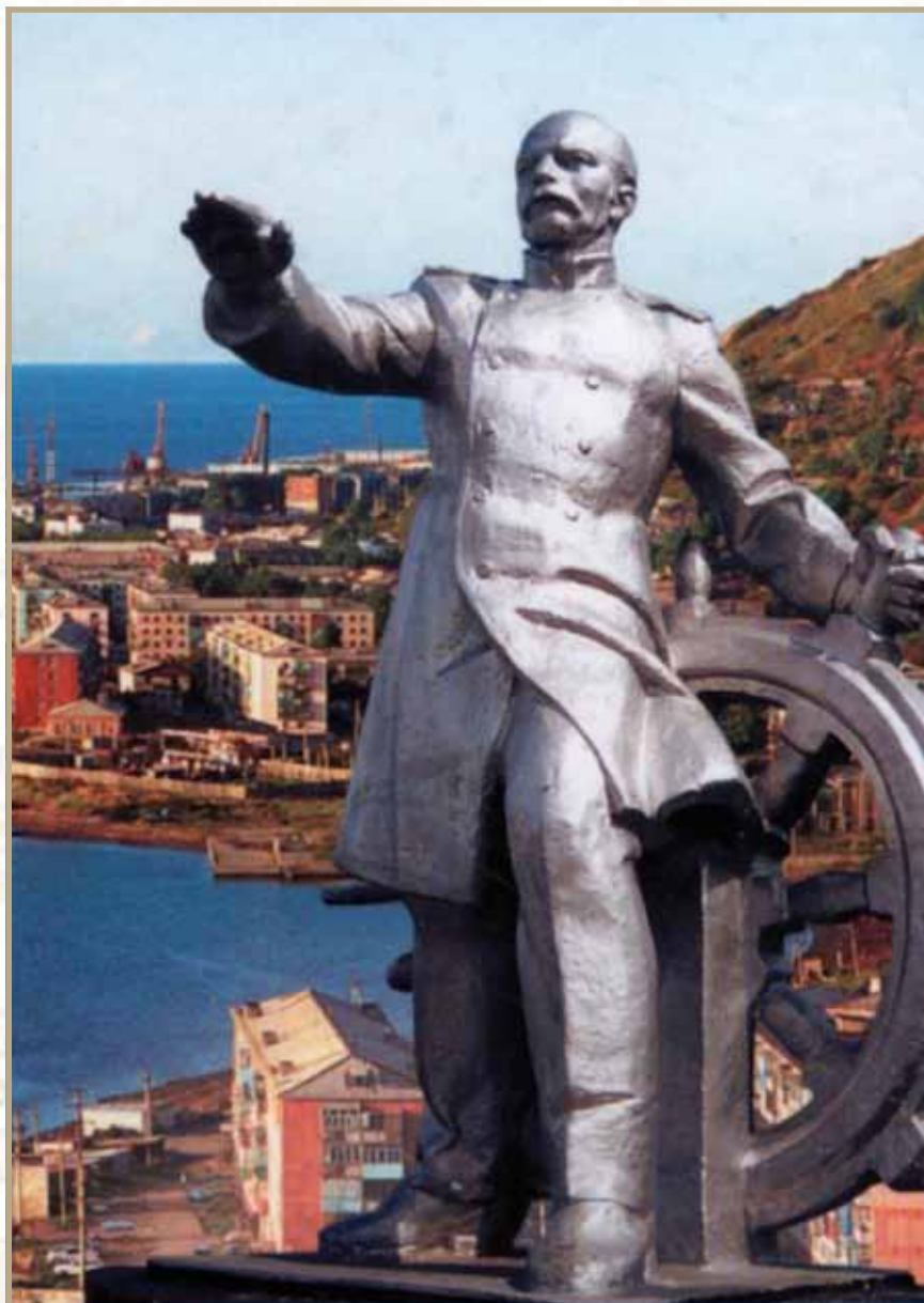
Ил. 4. Памятник адмиралу Г.И. Невельскому на фоне города его имени

Из книги «С морем повенчанный. Городу Невельску — 150 лет», Хабаровск: Издательский дом «Приамурские ведомости», 2004 год