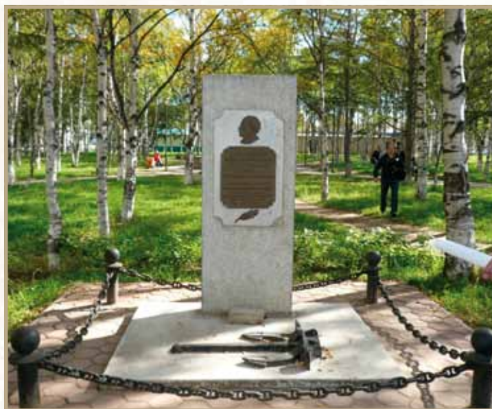
Ил. 17. Памятный знак в пгт Ноглики Сахалинской области Прямоугольный бетонный постамент размером 1,95 x 0,79 метра, на лицевой части укреплена металлическая пластина с медным барельефом Г.И. Невельского и текстом: «В честь первой высадки Г.И. Невельского 1849 г. от курсантов, преподавателей и сотрудников ДВВИМУ им. адмирала Г.И. Невельского. Мемориальная доска установлена экипажами «Россия» и «Родина» 1973 г.»

Проект Николая Кондырева Литейщик мастерских ДВВИМУ Юрий Федоренко Фото С. Пономарёва, 2009 год