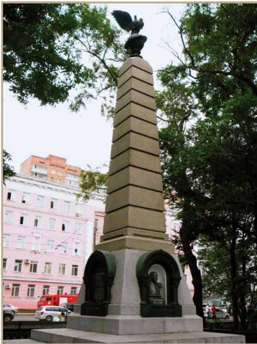
Ил. 14. Памятник Г.И. Невельскому и участникам Амурской и Сахалинской экспедиций в г. Владивостоке