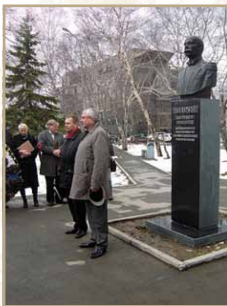
Ил. 16. Бюст Г.И. Невельского в сквере его имени на ул. Сахалинской г. Южно-Сахалинска, открыт в 1982 году

Память адмирала увековечена в названиях домов культуры, учебных заведений (во Владивостоке и Иваново), улиц, скверов, набережных (Хабаровск), в мемориальных досках (Санкт-Петербург, Иркутск; Ноглики на севере Сахалинской области). В частности, мемориальная доска в пгт Ноглики установлена в честь первой высадки на остров экспедиции Г.И. Невельского.