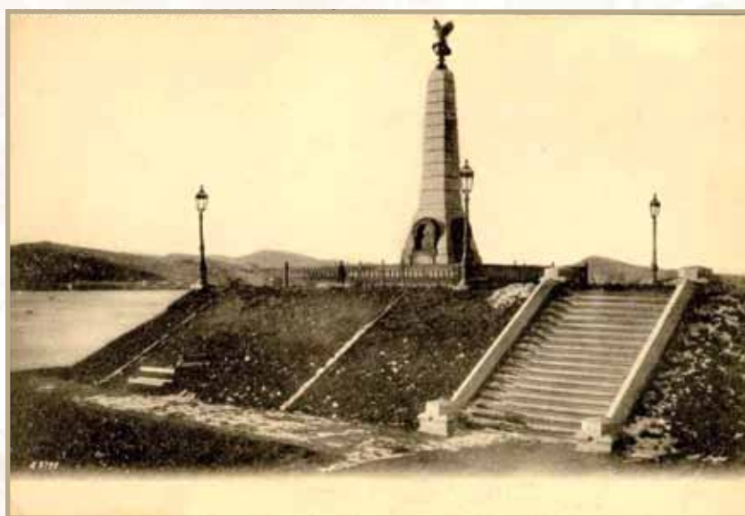
Ил. 8. Владивосток. Первый в России памятник адмиралу Невельскому

Первый памятник Геннадию Ивановичу начали сооружать во Владивостоке на народные деньги в 1891 году. Открытие состоялось в 1897 году [2].