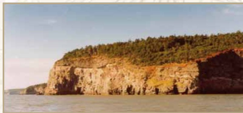
Ил. 7. Мыс Невельского в Татарском проливе