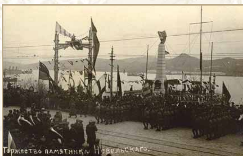
Ил. 9. Торжество у памятника адмиралу Г.И. Невельскому во Владивостоке