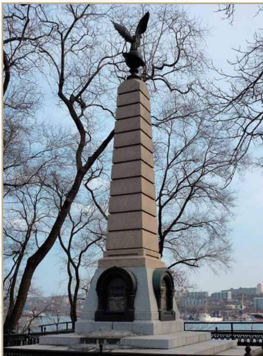
Ил. 15. Памятник Г.И. Невельскому в наше время. Владивосток, вид на бухту