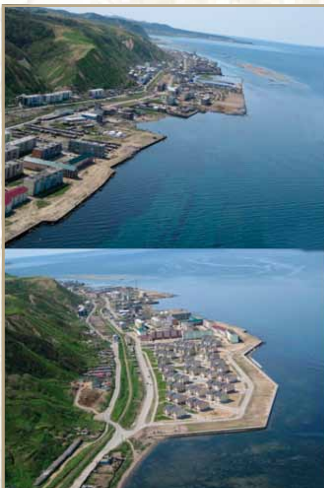
Ил. 3. Город Невельск Сахалинской области, отстроенный после землетрясения 2007 года